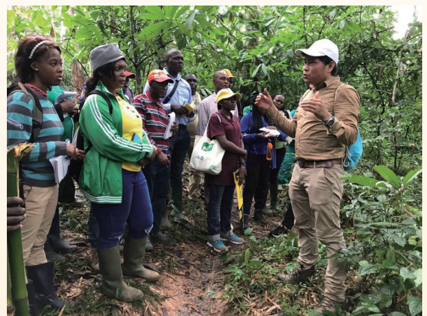
《竹子生物质能源与碳汇评估手册》培训班在喀麦隆和加纳举行。

为履行提供竹藤相关信息与政策的使命,GABAR为成员国及其他国家的决策者、投资者和竹藤从业人员编制一系列指导性文件,包括《泰国竹资源价值链评估报告》《利用竹藤资源修复生态系统战略计划》《竹林生态系统服务框架》(与国际林业研究中心合作完成)、INBAR政策报告《竹资源助力循环经济发展》(该报告于12月在西班牙马德里举行的《联合国气候变化框架公约》第二十五次缔约方大会正式发布)。