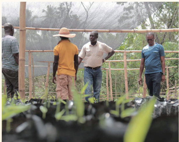
左: 加纳竹藤家具制作培训班学员; 右: 项目新建成的竹苗圃基地。