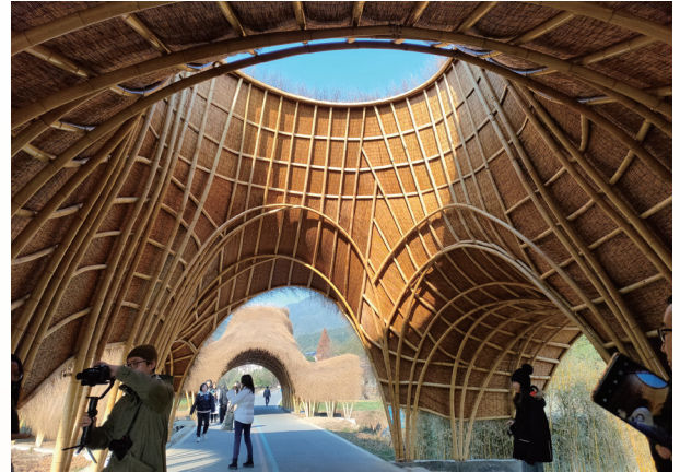
左：斐济林业部部长奥塞亚·奈克姆访问 INBAR 总部；右：2019 第二届全国高校竹设计建造大赛参赛作品。