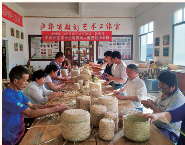
中国丹霞赤水竹编传承人技能培训班助力世界遗产地保护。

短期培训结束后，INBAR鼓励学员成为讲师，为自己企业的员工开展新一轮培训，以提高企业综合能力建设。在竹子宣传“大使”的推动下，通过新开发的线上竹工艺培训课程，传统的竹编工艺有望再次成为赤水可持续就业的主要来源。