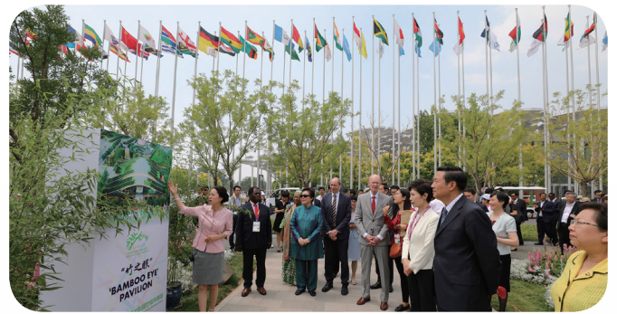
下排：包括喀麦隆、中国、加蓬、牙买加、菲律宾、卢旺达和斯里兰卡等在内的许多国家在国际竹藤组织园“竹之眼”展馆举办各具特色的文化活动。