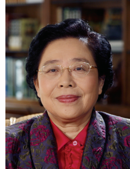
江泽慧 国际竹藤组织董事会 联合主席

感谢您阅读国际竹藤组织 (INBAR) 2019 年度报告, 关注全球竹藤事业。