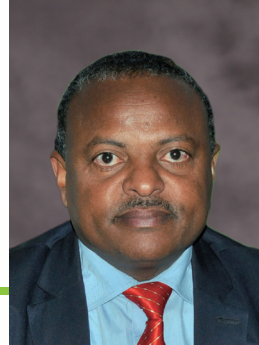
塞里希·盖塔宏 国际竹藤组织董事会主席