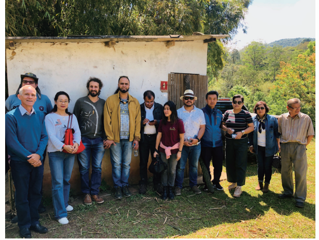
左：国际竹藤组织第十一届理事会会议在 INBAR 总部举行；右：INBAR 代表团考察巴西圣保罗竹产业。