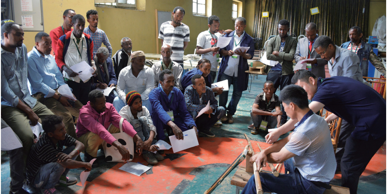
中国 - 荷兰 - 东非竹产业价值链开发项目在埃塞俄比亚、肯尼亚和乌干达开展各类培训，数千余人从中受益。