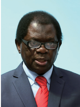
阿里·穆秋姆 国际竹藤组织总干事

我非常荣幸接任INBAR第五任总干事一职。自2019年4月正式加入INBAR以来，我坚定不移地履行INBAR使命，在世界范围内推动竹藤资源开发与利用，助力实现可持续发展。