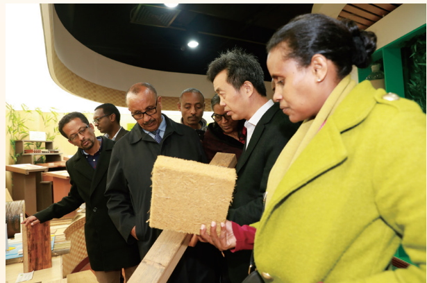
左:总干事穆秋姆在《联合国气候变化框架公约》第二十五次缔约方大会全体会议上发言;右:埃塞俄比亚环境、林业和气候变化委员会代表团访问INBAR总部。