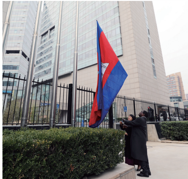
左：刚果共和国驻华大使丹尼尔·奥瓦萨阁下在升旗仪式上致辞；右：柬埔寨王国驻华大使凯·西索达与总干事穆秋姆缓缓升起柬埔寨国旗。

刚果共和国、柬埔寨王国于2019年加入INBAR，分别成为第45个和第46个成员国。