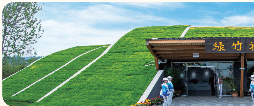
上排：除“竹之眼”展馆（中图）外，国际竹藤组织园还展示《盛放》（左一）、《应用竹建筑》（右二）、《莲屋》（右一）等 2019 国际竹建筑设计大赛获奖作品。