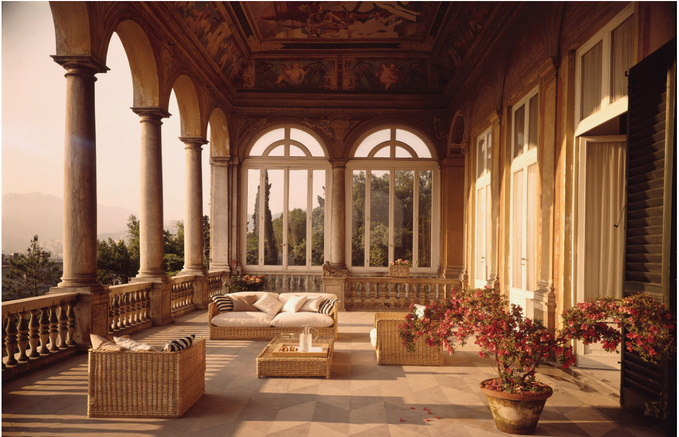
La rénovation de la Villa Saluzzo Bombrini en Italie, inclut du mobilier en rotin.

quantités importantes à la fin des années 1800 par un certain nombre d'entreprises. Parmi celles-ci, la Dryad Furniture Works utilisait exclusivement du rotin, plutôt que du saule ou du bambou, comme matière première principale. La Dryade a été créée en 1907, peu de temps après, la société s'était forgée une réputation pour ses conceptions originales de haute qualité et a été chargée en 1914 de fournir des chaises et des tables en rotin pour des salons du Titanic.