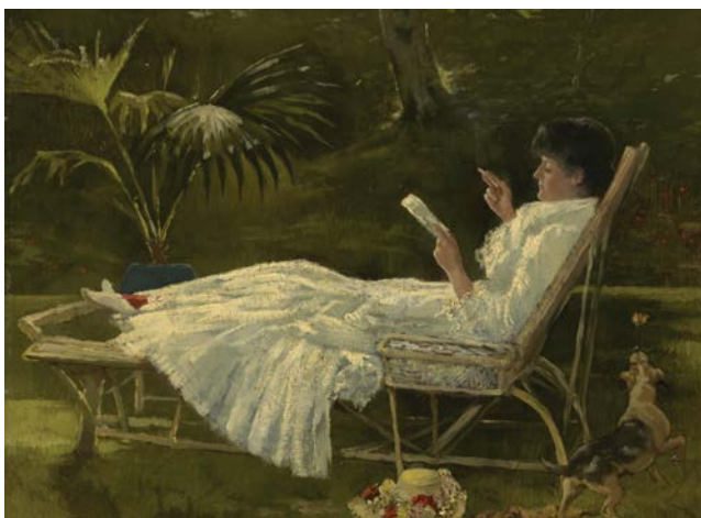
La femme lisant de Barbour (vers 1910) montre une jeune femme allongée sur une chaise longue en rotin.

La vannerie était une technique courante dans le nord de l'Europe médiévale, et le saule, qui pousse en abondance sur tout le continent, était le matériau de tissage de prédilection. Le rotin en tant que matériau pour fabriquer des meubles