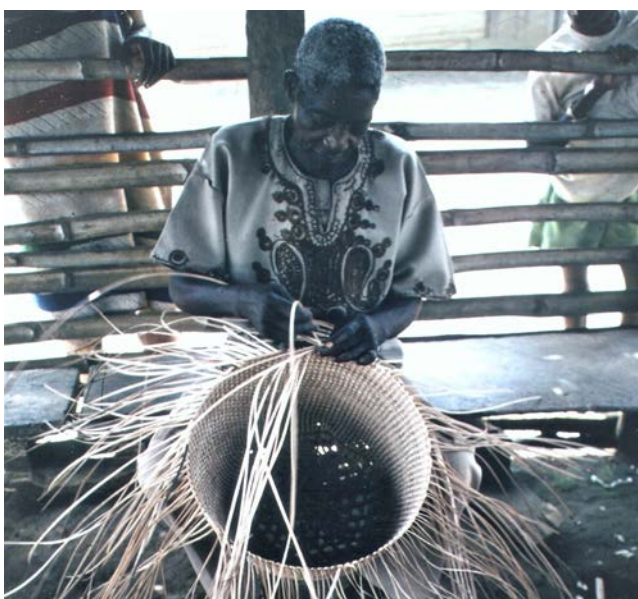
Le tissage du rotin est un artisanat traditionnel dans de nombreuses régions d'Afrique centrale et occidentale.

Cependant, dans les rares cas où la tenure des ressources est plus clairement définie, on observe que les exploitants laissent les jeunes tiges se régénérer et fournir de futures sources de cannes,