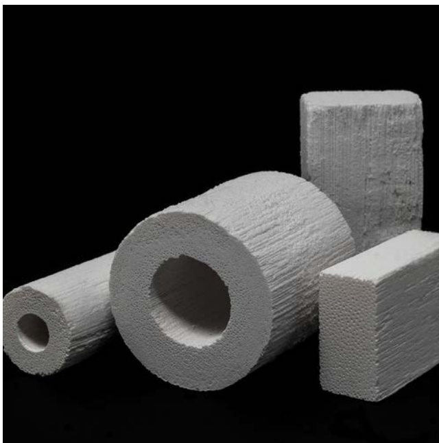
L'architecture interne du matériau osseux en rotin ressemble étroitement à l'os humain, il permet la régénération osseuse.

Le problème n'est toujours pas résolu. Même l'autogreffe (greffe d'un os venant d'une autre partie du corps sur une même personne), la référence absolue en termes de régénération osseuse, présente des inconvénients tels que la douleur, la morbidité du site donneur, des saignements et des fractures du bassin. Elle est de plus limitée par la quantité et la qualité de l'os disponible.