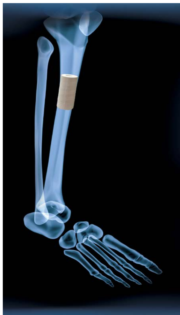
GreenBone entrera sur le marché en 2022 en tant que produit pour les traumatismes et les défauts osseux orthopédiques.