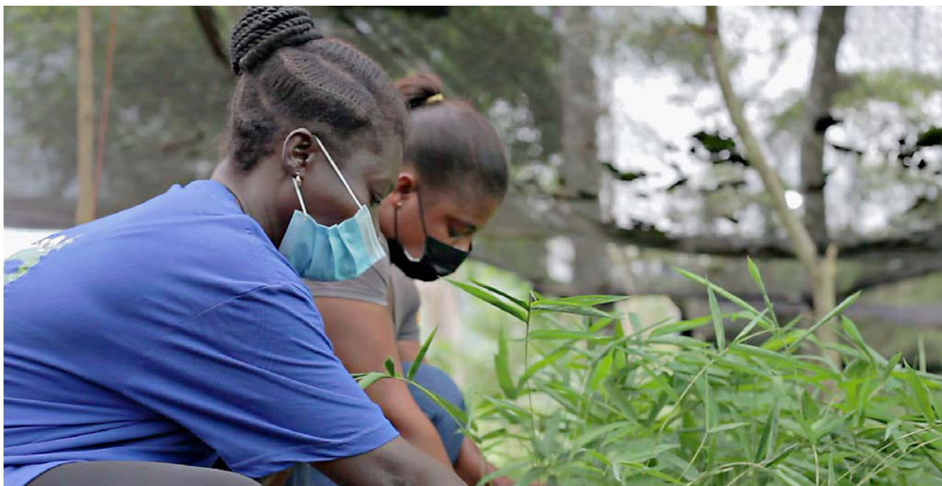
Plantation de bambous au Ghana, dans le cadre du récent voyage d'étude en Afrique.