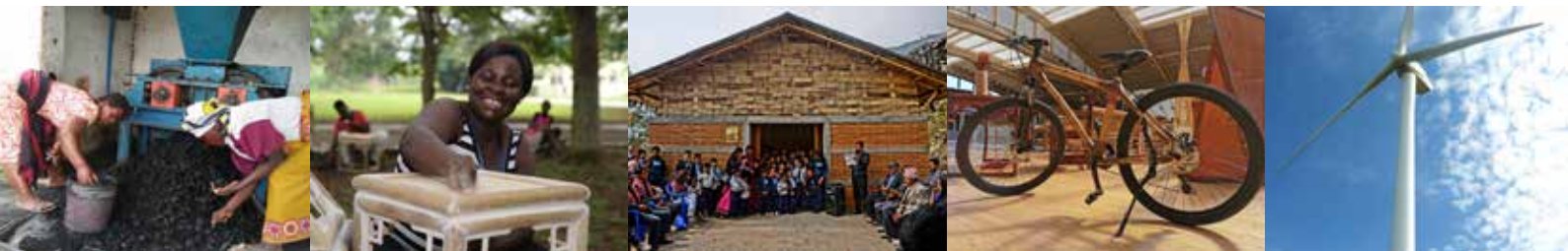
Figure 2. Fabrication de charbon de bambou en Tanzanie, formation à la fabrication de meubles en bambou au Ghana (photos: INBAR), école construite en bambou et terre au Népal (photo: Abari), vélo en bambou et des lames en bambou pour turbine à vent (photos: INBAR).