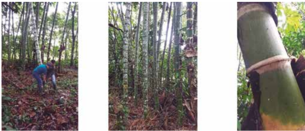
Figura 3. Guadua aff. angustifolia Kunth: a) toma de muestras, b) hábito, c) entrenudos