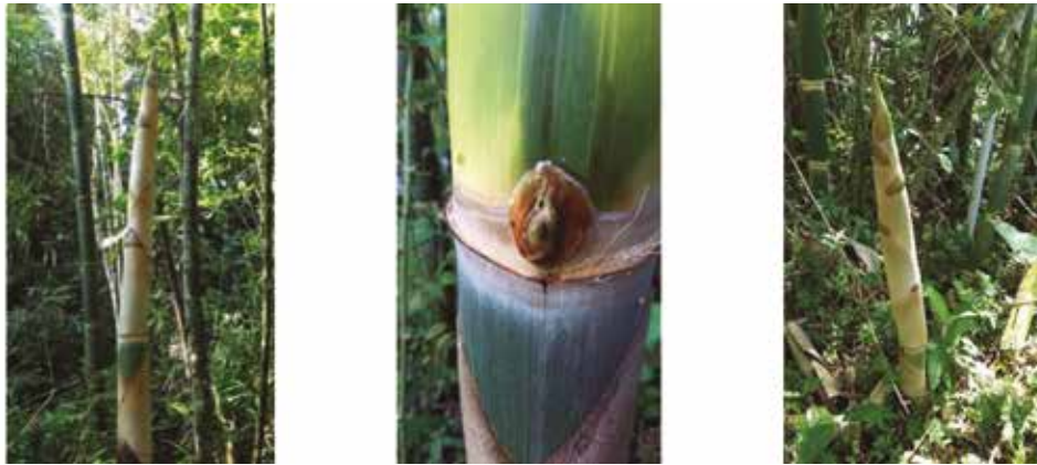
Figura 4. Guadua incana : a) brote nuevo, b) yema, c) detalle del brote nuevo.

SERVICIOS ECOSISTÉMICOS: Contribuye a la conservación de la diversidad, a la reducción de la temperatura, al mejoramiento de la calidad del suelo, a la protección de las cuencas hídricas, a la captura de CO 2 .