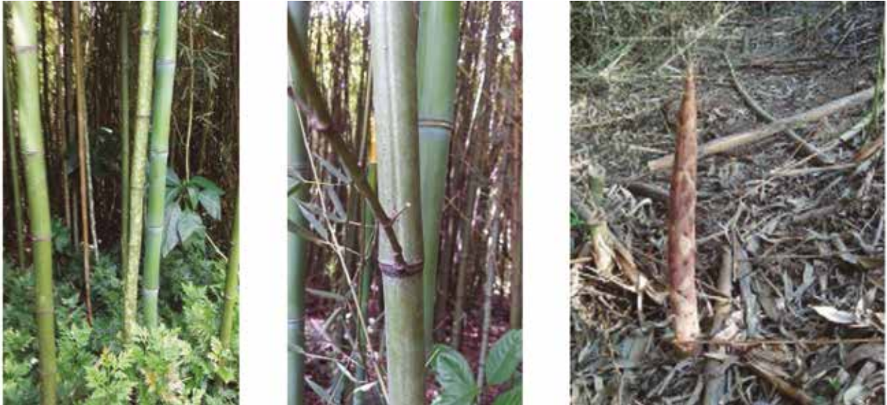
Figura 13. Phyllostachys aurea : a) hábitat, b) culmo con ramificación en la región del nudo, c) brote nuevo

SERVICIOS ECOSISTÉMICOS: Esta especie es ideal para el control de la erosión porque sus culmos no son tan grandes y pesados, y sus rizomas leptomorfos forman una densa red en el subsuelo. Sirven de refugio a la fauna y flora local.