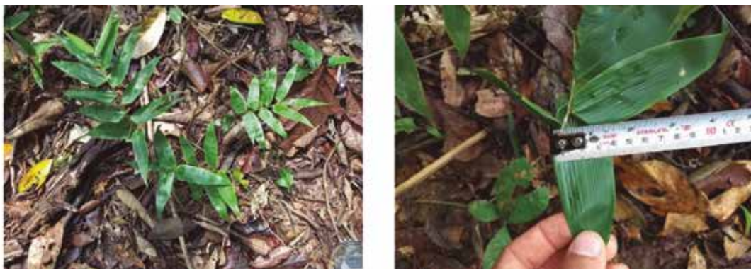
Figura 6. Agnesia lorentensis : a) planta en el sotobosque, b) lámina foliar redondeada en la base y asimétrica.

SERVICIOS ECOSISTÉMICOS: Contribuye a la conservación de la riqueza biológica de la selva amazónica, a la conservación de la entomofauna amazónica y a la conservación de los insectos que la polinizan. También, permite la conservación y calidad de los suelos amazónicos.