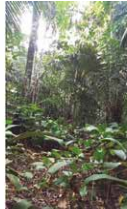
Figura 9. Pariana campestris : a) follaje, b) inflorescencia, c) hábitat