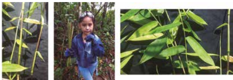
Figura 7. Olyra latifolia : a) culmos maculados, b) uso como pitillo, c) follaje.

SERVICIOS ECOSISTÉMICOS: Contribuye a la conservación de la riqueza biológica de la selva amazónica y de la entomofauna. También aporta en la conservación y calidad de los suelos.