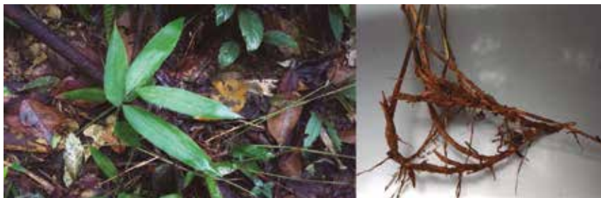
Figura 8. Pariana aff. aurita : a) planta en sitio húmedo y sombreado, b) rizomas estoloníferos.

SERVICIOS ECOSISTÉMICOS: Contribuye a la conservación de la riqueza biológica de la selva Amazónica, de la entomofauna del lugar y de los insectos que la polinizan. También permite la conservación y la preservación de la calidad de los suelos amazónicos.