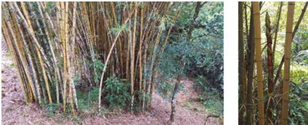
Figura 12. Bambusa vulgaris var. vittata : a) hábito; b) brote nuevo y culmos

SERVICIOS ECOSISTÉMICOS: Se utiliza para proteger la rivera de los ríos y para estabilizar los suelos, como cinturón de protección y control de la erosión en terrenos inclinados. Se planta para delimitar terrenos y como barrera rompeviento.