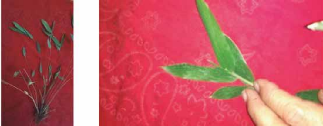
Figura 1. Cryptochloa unispiculata : a) planta completa, b) Inflorescencia terminal

SERVICIOS ECOSISTÉMICOS: Contribuye a la conservación de los insectos polinizadores del sotobosque de la selva húmeda tropical, los cuales depositan los huevos en estas plantas. También aporta en la conservación y calidad de los suelos amazónicos.