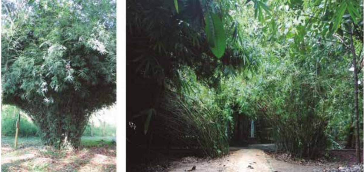
Figura 11. Bambusa multiplex : a) hábito, b) paisajismo en el Colegio Piaget, Florencia, Caquetá.

SERVICIOS ECOSISTÉMICOS: Esta especie es ideal para el control de erosión porque sus culmos son delgados y poco pesados. Sirven, además, de refugio a la fauna y flora local.