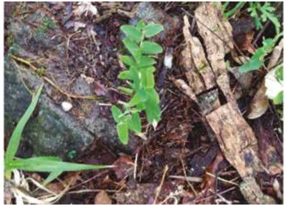
Figura 10. Raddiella esenbeckii : a) hábitat, b) detalle follaje