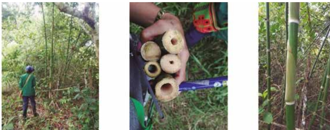
Figura 5. Guadua uncinata : a) hábito de la planta, b) secciones transversales del culmo, c) Hoja caulinar.

SERVICIOS ECOSISTÉMICOS: Guadua uncinata contribuye a la conservación de ecosistemas pantanosos o con alto nivel freático, a la conservación de la fauna y flora específica de este tipo de ecosistemas y desempeña un papel importante en la conectividad de ecosistemas pantanosos con la tierra firme.