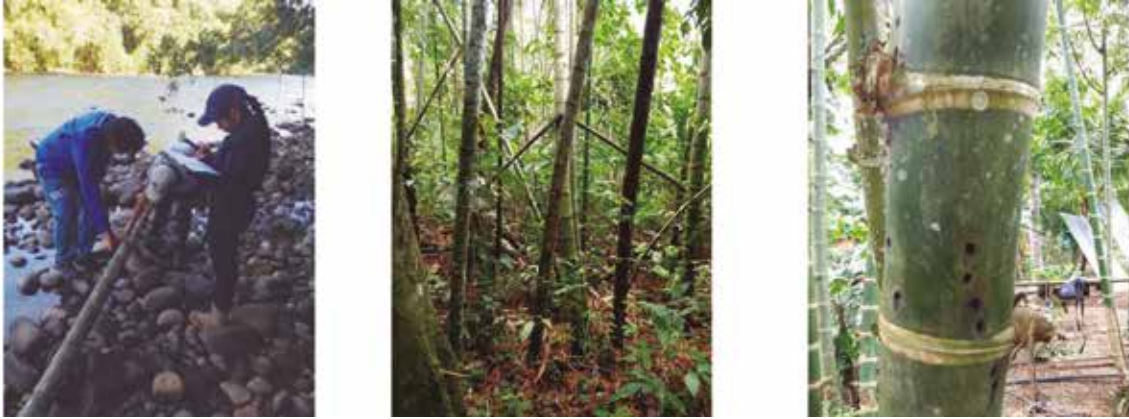
Figura 2. Guadua angustifolia Kunth: a) toma de datos, b) hábito, c) entrenudo

SERVICIOS ECOSISTÉMICOS: Contribuye a la conservación de la diversidad, a la reducción de la temperatura, al mejoramiento de la calidad del suelo, a la protección de las cuencas hídricas, a la captura de CO 2 , a la protección contra vientos y al embellecimiento del paisaje.