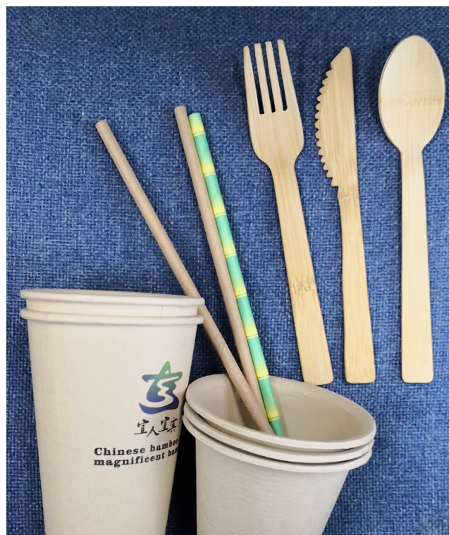
El bambú puede utilizarse en lugar del plástico para fabricar cubiertos, vasos y sorbetes.

De 2013 a 2020, China realizó importantes avances científicos y tecnológicos en el sector del bambú en ámbitos como la investigación, el desarrollo de nuevos productos y las normas. A finales de 2020, se habían conseguido 135 nuevos logros científicos y tecnológicos en el sector del bambú, de los cuales seis recibieron el segundo lugar en los Premios Nacionales de Progreso Científico y Tecnológico.