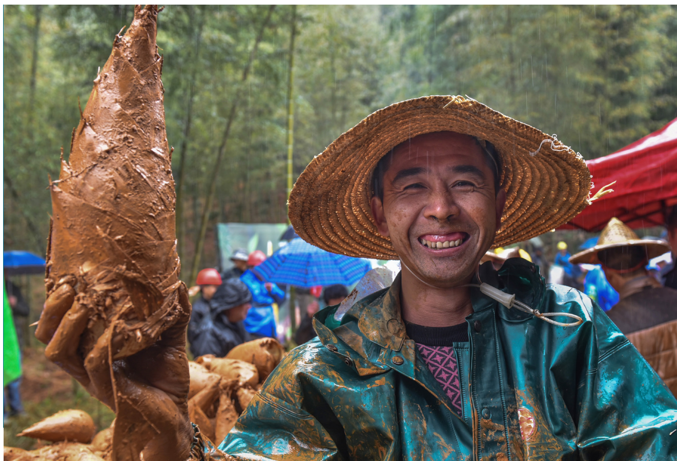
Concurso de cosecha de brotes de bambú celebrado en Jian'ou, Fujian.

regularidad, creando una amplia gama de productos duraderos, el bambú puede crear un considerable sumidero de carbono a lo largo del tiempo. En este sentido, China fue el primer país que propuso el "almacenamiento de bambú", mediante el cual el bambú se cosecha, se somete a un tratamiento previo, se transforma en materia prima y luego se almacena, listo para ser liberado y procesado de nuevo a demanda. Esto no sólo garantiza el desarrollo saludable de los bosques de bambú y su conversión en productos, sino que también proporciona una fuente de ingresos estable a los productores de bambú, y evita que el bambú cosechado sin tratar se pudra o infeste. Las provincias de Sichuan y Anhui ya han llevado a cabo proyectos piloto de almacenamiento de bambú.