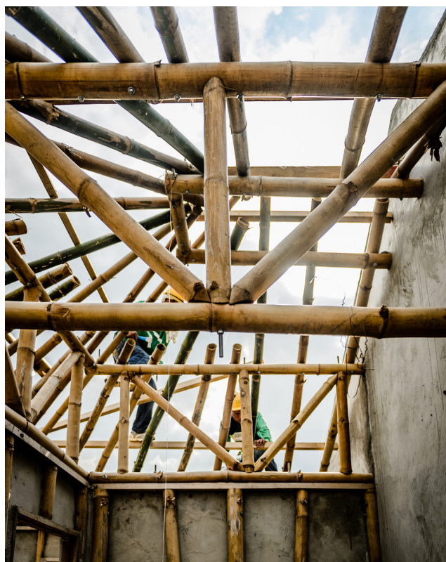
Se utiliza una combinación de cemento y bambú para crear estructuras ligeras y resistentes a terremotos y tifones.

El CBFT no es sólo una tecnología innovadora para Filipinas. Base Bahay también ha iniciado una labor de colaboración internacional en Nepal, otro país con abundancia natural de bambú y un historial de catástrofes naturales. Junto con Hábitat para la Humanidad y Sahara Nepal, Base Bahay ha construido casas para 35 familias pobres del distrito de Jhapa.