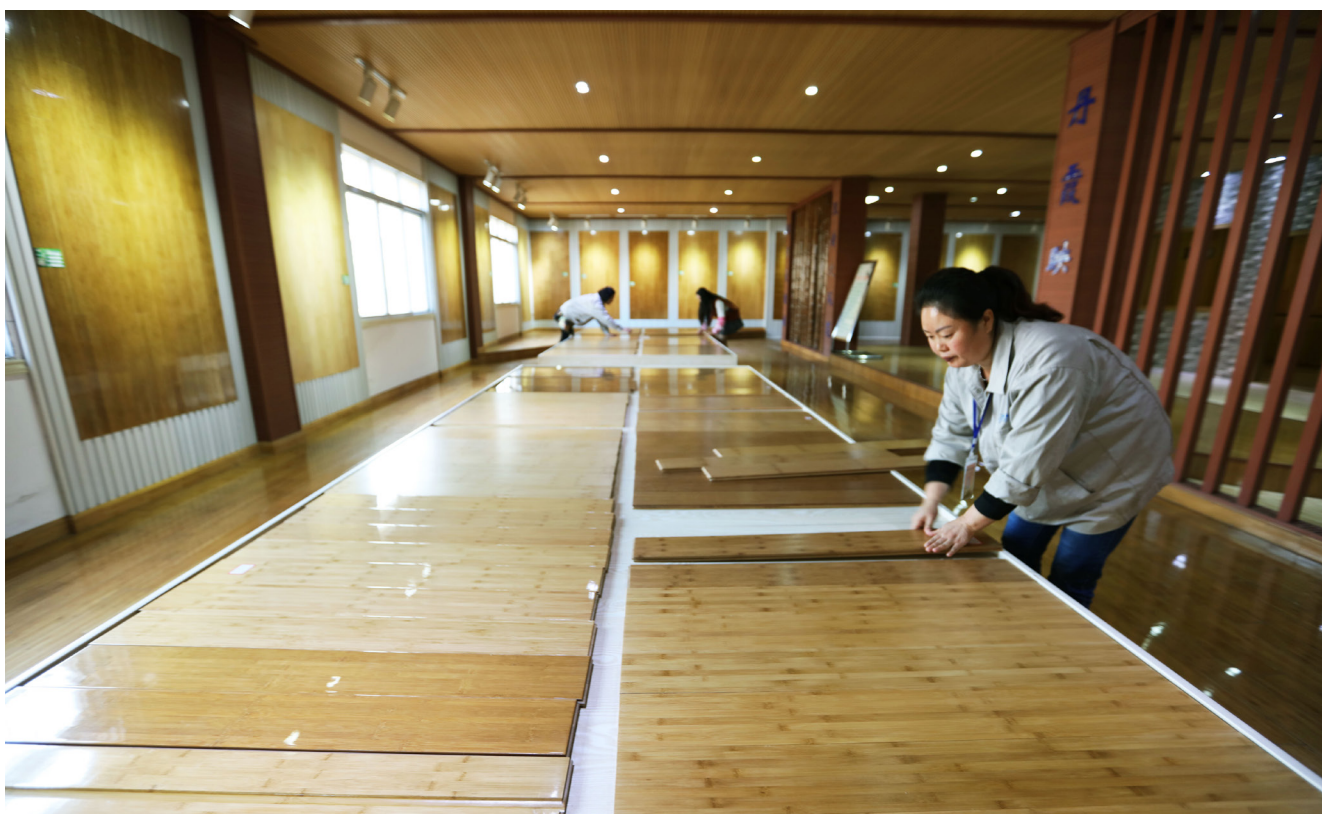
Los pisos de bambú son una alternativa sostenible con bajas emisiones de carbono a otros materiales.

Como crece rápidamente y puede cosecharse con