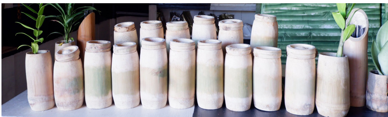
Tazas hechas con cañas de bambú.

Lea la hoja informativa aquí: www.inbar.int/resources/inbar_publications/bamboo-as-a-plastic-alternative-fact-sheet/