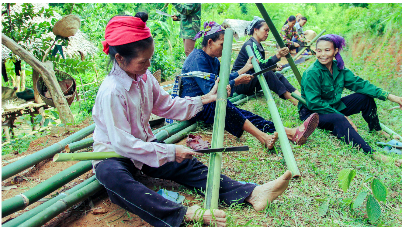
Existe un mercado internacional creciente para los productos de bambú fabricados en Viet Nam.

bambú lung y sensibilizar a las comunidades locales, el proyecto ha dado lugar a una gestión sostenible de los bosques del bambú lung.