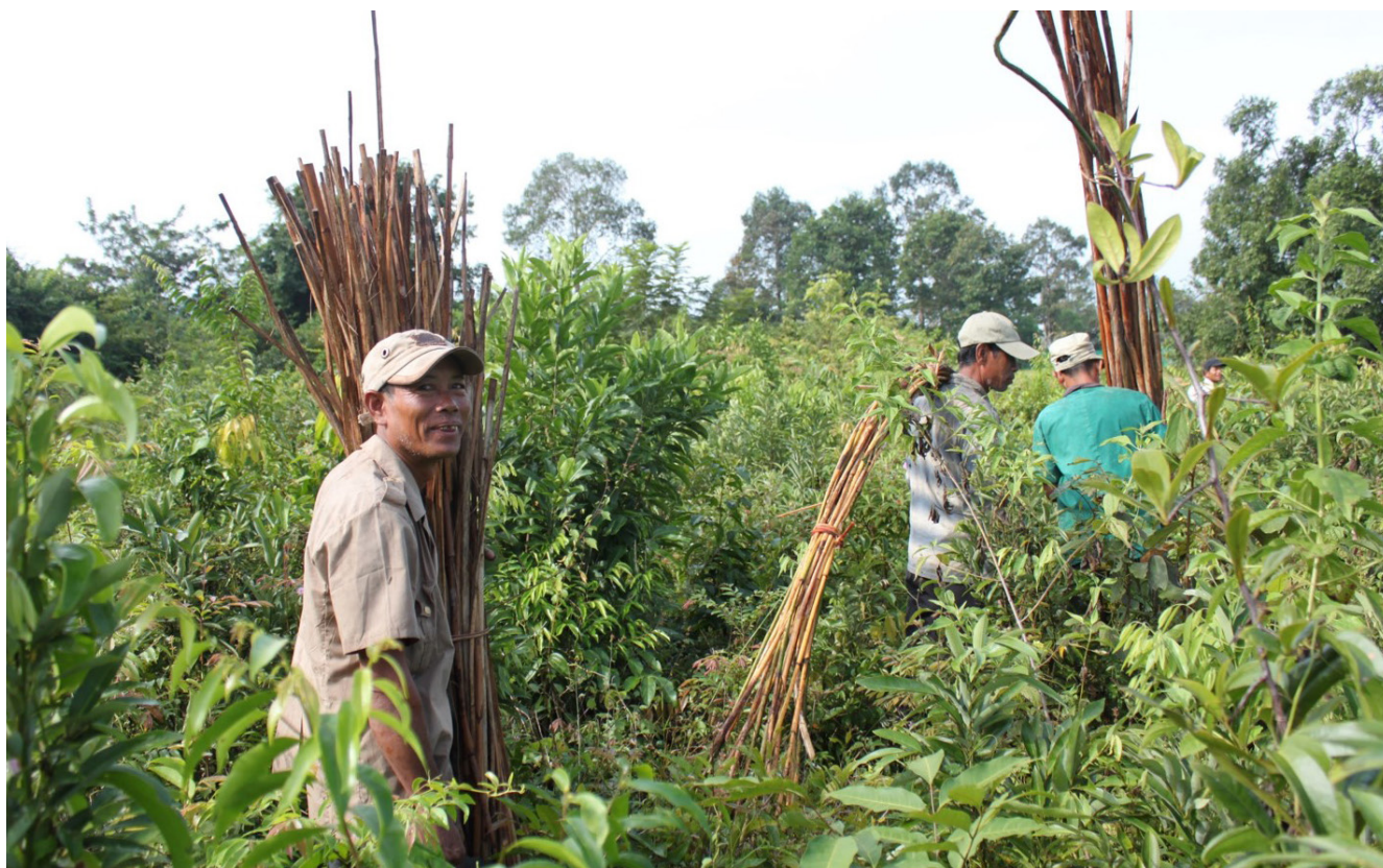
La producción sostenible de ratán es una parte importante de los medios de vida de las comunidades asiáticas.

La "sostenibilidad" del ratán puede definirse desde una perspectiva ecológica, así como institucional y de gestión. Ambas categorías son interdependientes y juntas ayudan a definir la sostenibilidad general de los recursos de ratán. Mientras que la sostenibilidad ecológica del ratán natural se mide por el hábitat de la planta, el tipo de bosque, el crecimiento anual de la biomasa y otros factores, su sostenibilidad institucional viene determinada por factores como las políticas y la normativa, las cosechas anuales permitidas, la certificación de sostenibilidad y las prácticas de gestión. Esto último incluye a los recolectores de ratán y a sus comunidades, y la cadena productiva de trabajadores, incluyendo a los recolectores, comerciantes y procesadores, quienes también influyen en la sostenibilidad del ratán.