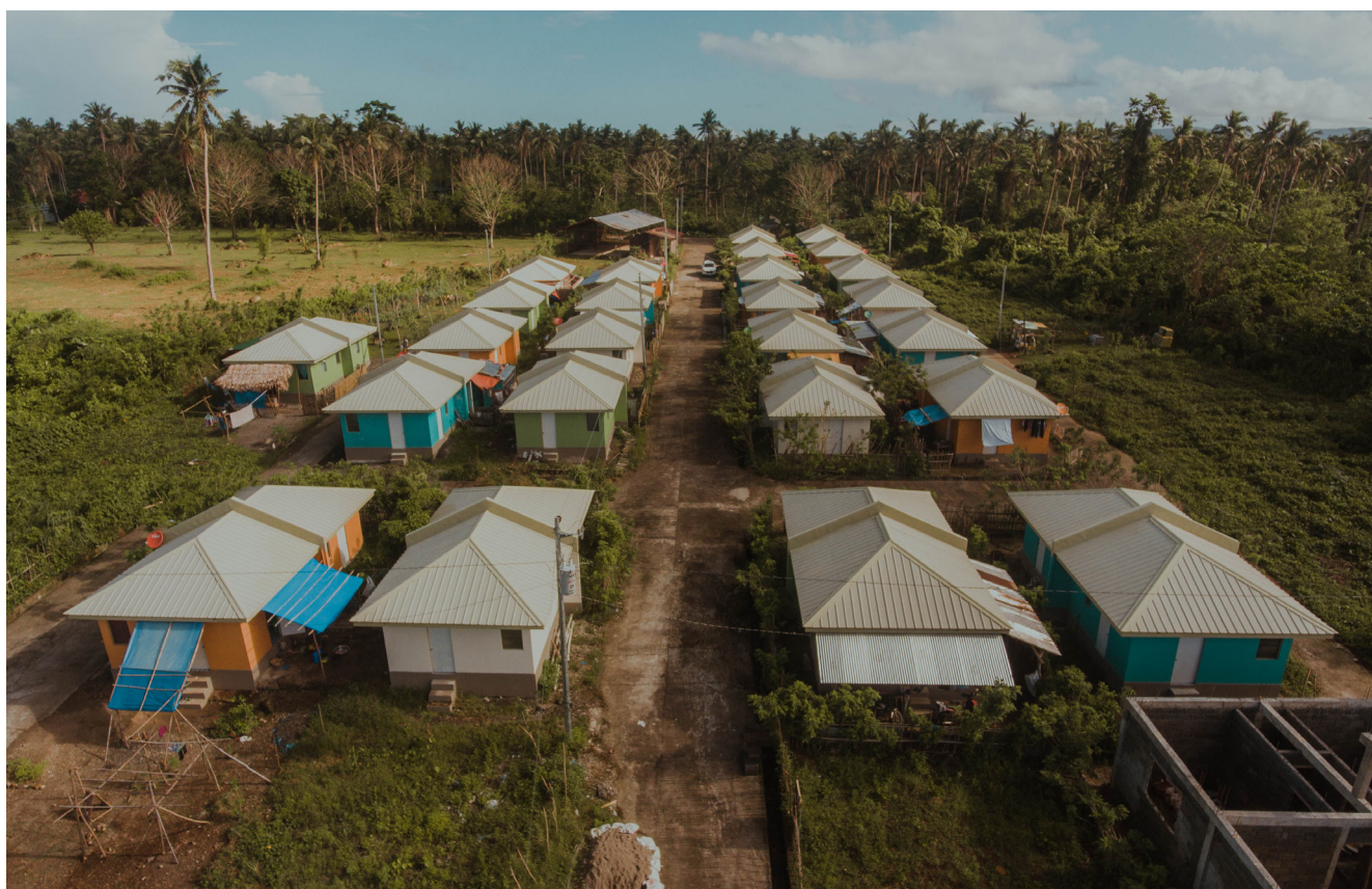
El diseño de las viviendas de bambú de bajo presupuesto de Base Bahay incluye un dormitorio, un baño, una cocina y un área común.

La Fundación Base Bahay es una organización sin fines de lucro creada y apoyada por la Fundación Hilti, una organización filantrópica con sede en Liechtenstein. Base Bahay eleva el nivel de la vivienda social a través de su tecnología de Marco de cemento y bambú (CBFT, por sus siglas en inglés). Esta tecnología, respaldada por una intensa investigación, mezcla el cemento convencional con el bambú cultivado localmente para construir estructuras ligeras y resistentes, adaptadas a las necesidades de las comunidades locales en zonas propensas a los riesgos naturales. Está reconocida por la "Acreditación de Tecnologías Innovadoras para la Vivienda" (AITECH, por sus siglas en inglés) de Filipinas