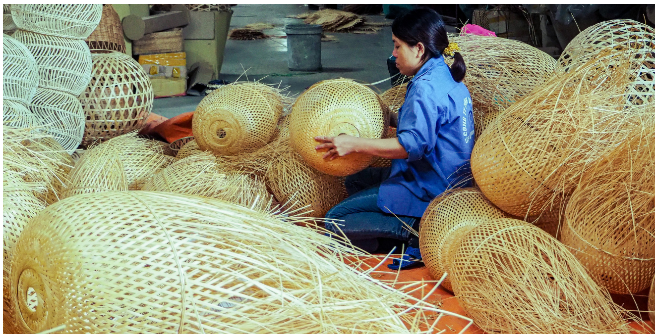
Una mujer local hace lámparas de tiras de bambú en la unidad de procesamiento de bambú de la empresa Duc Phong, comuna de Chau Thang, Nghe An.

Con la financiación del Gobierno alemán a través de la Iniciativa Internacional sobre el Clima, RECOFTC se asoció con el Fondo Forestal de Nghe An del gobierno local y la Organización Internacional del Bambú y el Ratán (INBAR) para ayudar a las comunidades a restaurar sus bosques de bambú y utilizarlos para asegurar sus medios de vida de forma sostenible.