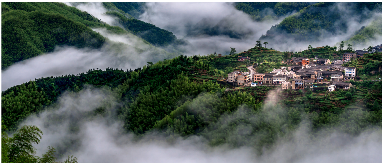
Pueblo rodeado por bosques de bambú en China.

que “En los últimos 20 años desde su fundación, INBAR ha desempeñado un papel positivo en la aceleración del desarrollo de los recursos mundiales de bambú y ratán, promoviendo la mitigación de la pobreza en las zonas productoras, impulsando el comercio de productos de bambú y ratán y facilitando el desarrollo sostenible. China seguirá apoyando los esfuerzos de INBAR y trabajando con la comunidad internacional para implementar la Agenda 2030 para el Desarrollo Sostenible y ayudar a lograr el progreso ecológico global, una comunidad de un futuro compartido para la humanidad y un mundo más hermoso.”