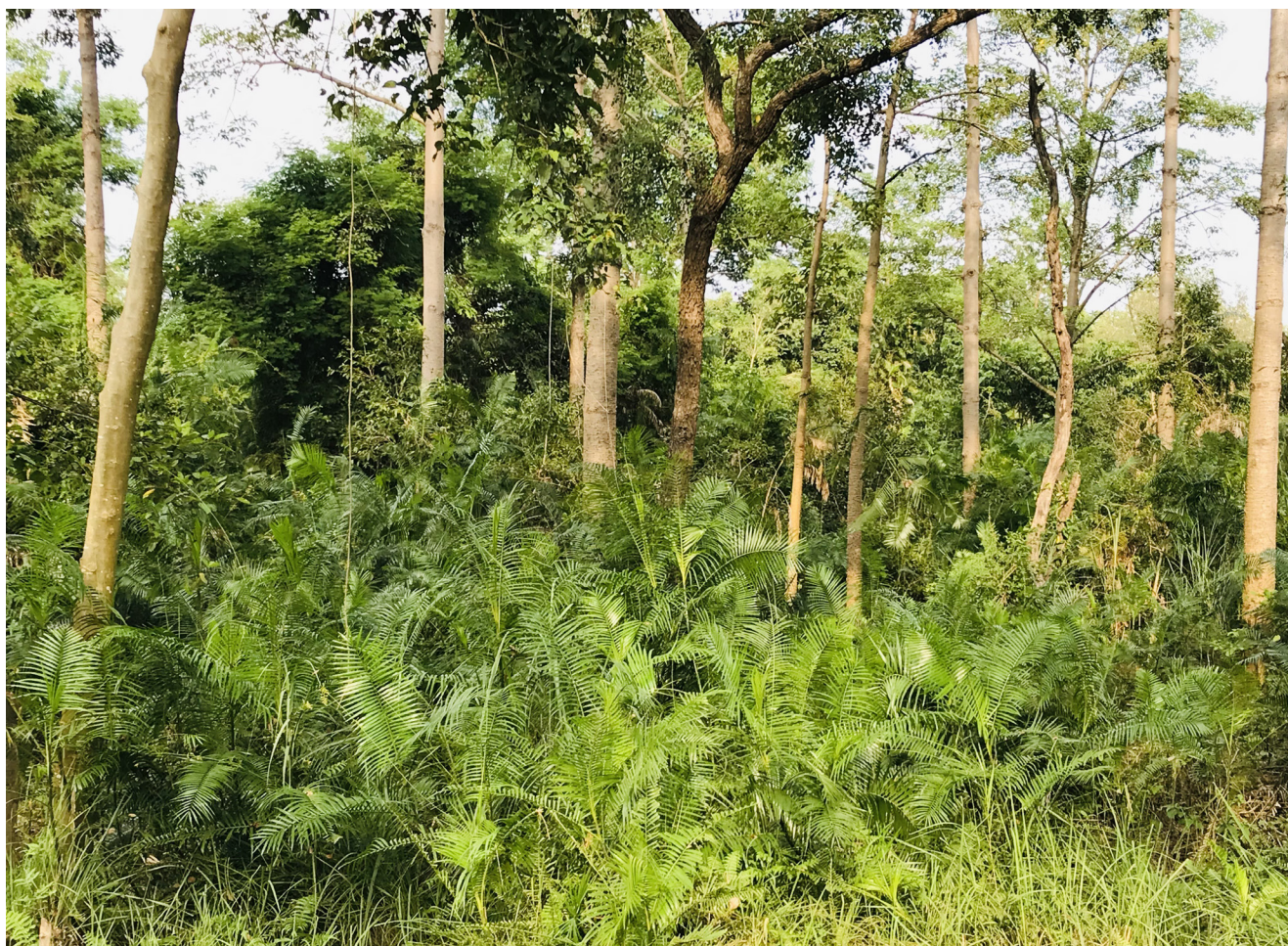
Regeneración natural del ratán en un bosque comunitario mediante la conservación.

En general, utilizando el marco de sostenibilidad, el análisis preliminar de los resultados del estudio de campo, que implicó la consulta a 103 recolectores, indicó que más del 90% del ratán de la zona de estudio se recolecta de forma sostenible. Esto puede atribuirse a varios factores: los bajos precios que se pagan actualmente a los recolectores en Sulawesi no atraen a un número excesivo de personas; el ratán sólo se recolecta cuando las cañas han madurado (en un plazo de 4 a 6 años), ya que las cañas más jóvenes son de menor calidad y no son comercializables; y los recolectores parecen entender que el ratán natural se regenera mejor en los bosques intactos, lo que se interpreta como una fuerte ética de gestión.