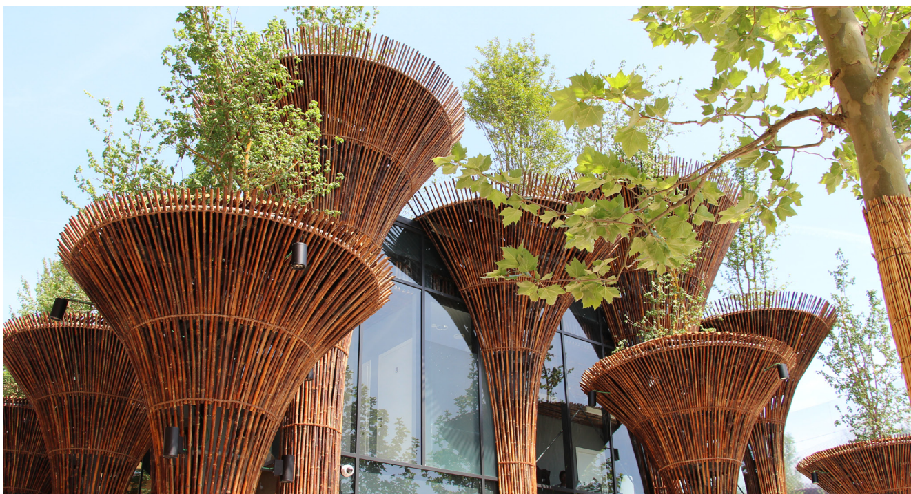
Diseñado por Vo Trong Nghia Architects con el arquitecto asociado Takashi Niwa, el llamativo Pabellón de Viet Nam en la Expo de Milán de 2015 utilizó revestimiento de bambú en sus columnas.

promoción de la formación técnica a nivel internacional y nacional, y la contribución de artículos en revistas y publicaciones. Esperamos que INBAR siga ampliando el apoyo y reforzando la cooperación con Malasia para estudiar otros usos potenciales del bambú y el ratán.