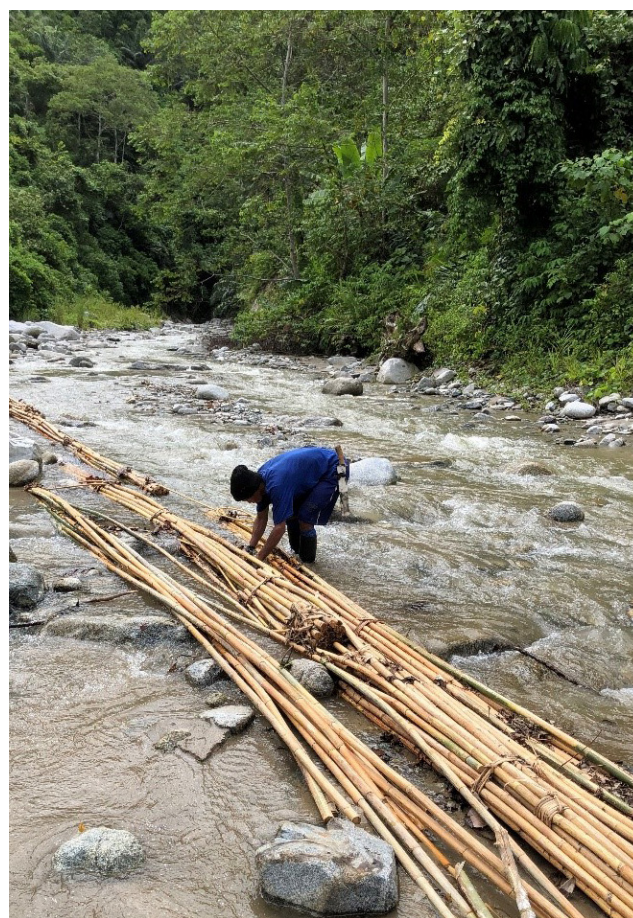
La recolección de ratán es un trabajo duro que requiere de mucho tiempo.

Indonesia, el mayor productor de ratán del mundo, representa el 80% del comercio mundial de ratán. La mayor parte de la recolección de ratán se realiza principalmente en los bosques naturales. Sin embargo, a pesar de la exigencia de que todas las recolecciones se realicen con un permiso expedido por el Ministerio de Medio Ambiente y Regulación Forestal, la oferta sigue disminuyendo y la deforestación se acelera. Además, los precios son volátiles: entre 2012 y 2018, el