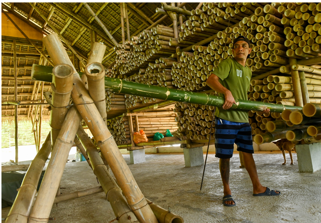
Las viviendas de bambú de Base Bahay emplean a un gran número de personas locales en toda la cadena de producción: desde la cosecha hasta el procesamiento y la construcción.