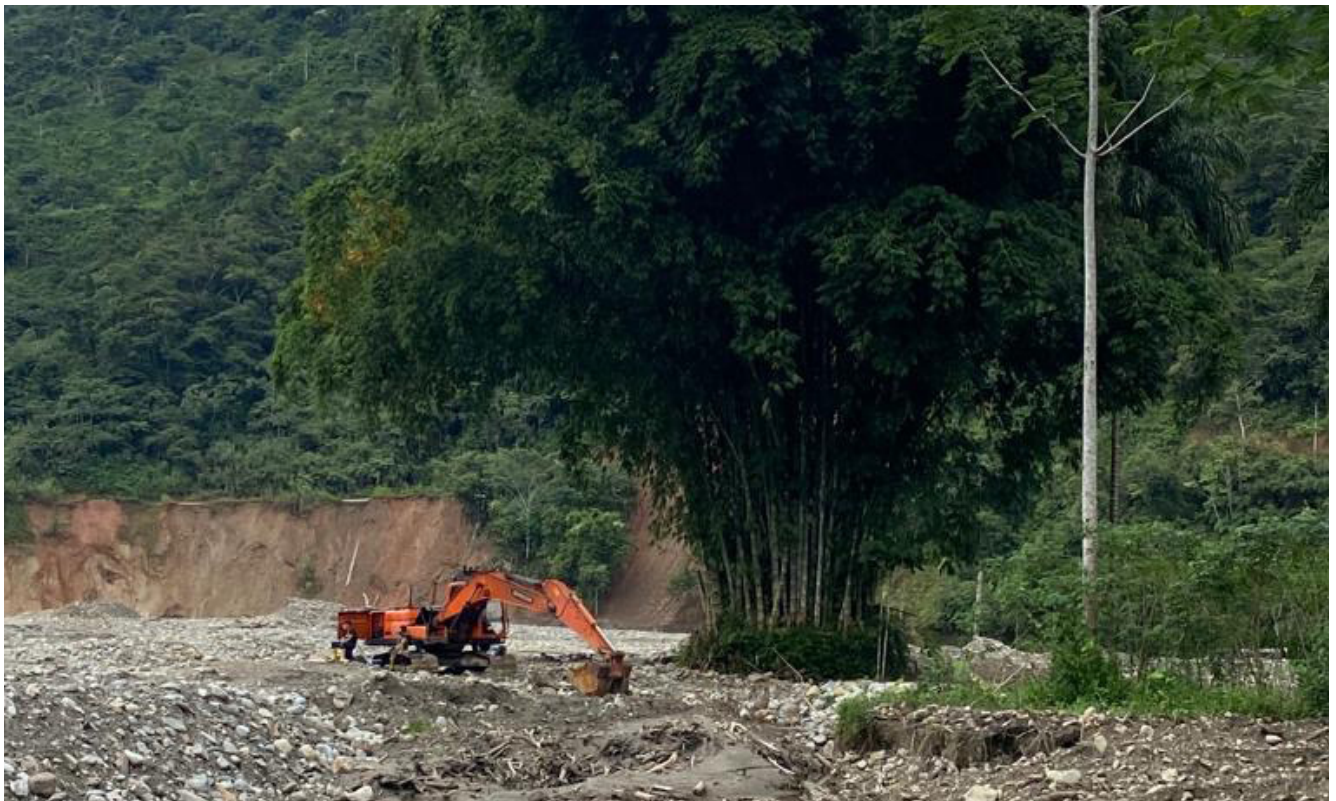
Un bosquet de bambous Dendrocalamus asper seul rescapé sur des terres dégradées dans la province de Zamora Chinchipe, en Équateur.

Quant aux bambous herbacés, encore moins bien connus, l'Amazonie est le berceau d'origine et l'épicentre de biodiversité de ces espèces plus petites appartenant à la sous-tribu des Olyreae , qui jouent un rôle important dans plusieurs écosystèmes amazoniens. Ces bambous, caractérisés par leur petite taille et leurs tiges souples et flexibles, nous rappellent que tous les bambous appartiennent à la famille des graminées, appelées Poaceae . Contrairement à d'autres graminées vivant dans les plaines ouvertes ou les prairies, les bambous sont principalement associés aux environnements forestiers et poussent dans le sous-bois de la dense forêt amazonienne, ce qui rend ces espèces de bambous miniatures relativement rares dans le règne végétal. À ce jour 124 espèces ont été découvertes, dont toutes sont endémiques aux Amériques, sauf deux d'entre elles et les études en cours continuent de dévoiler de nouvelles espèces.