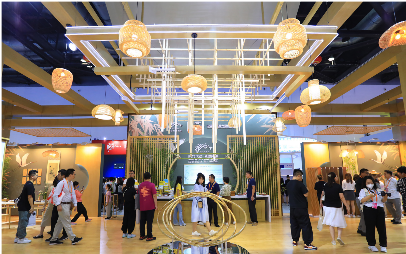
Le grand espace d'exposition de l'INBAR au CIFTIS 2023 à Beijing au Centre national des congrès de Chine.

L'INBAR commissionne des recherches, mène des projets et sensibilise au bambou et au rotin à travers ses 50 États membres