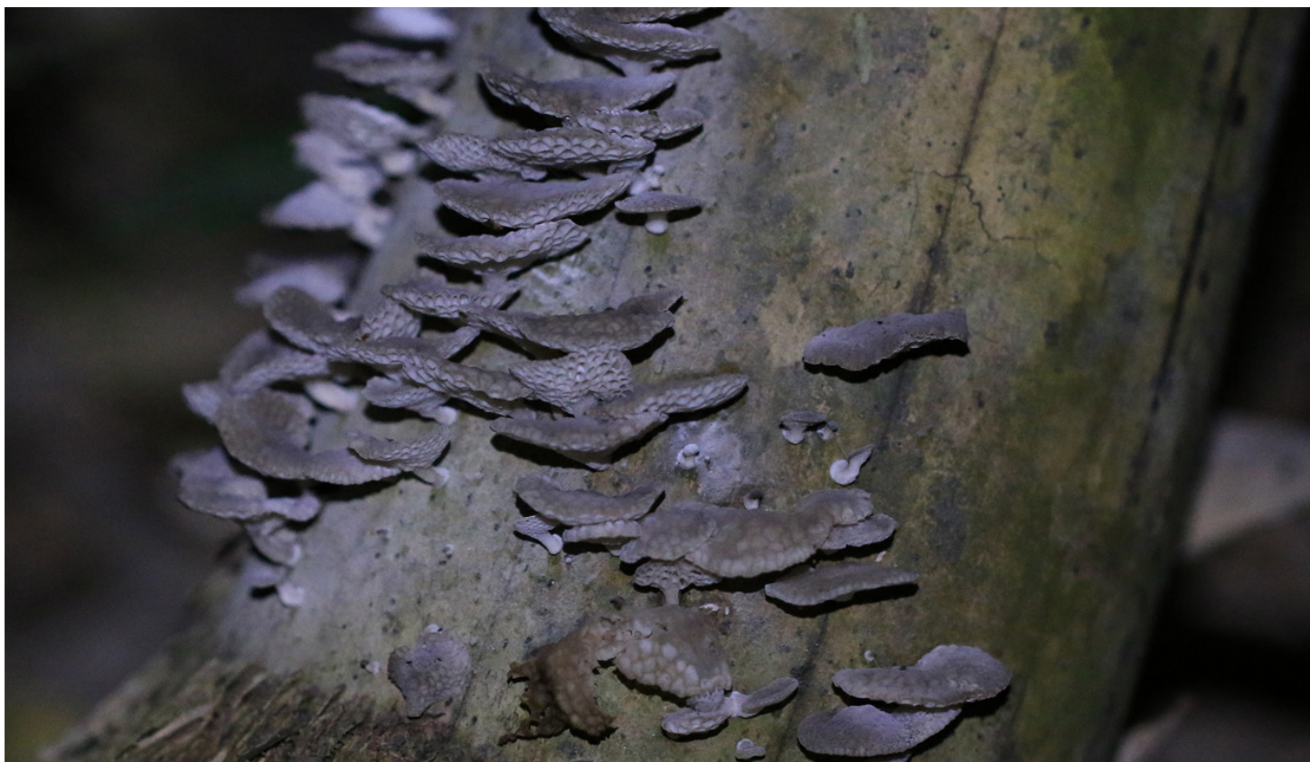
Les organes fructifères de Favolaschia xtbgensis observés sur une tige morte de Bambusa polymorpha dans le jardin botanique tropical de Xishuangbanna. Sur cette photo, le champignon est capturé sous l'éclairage d'une lampe de poche.