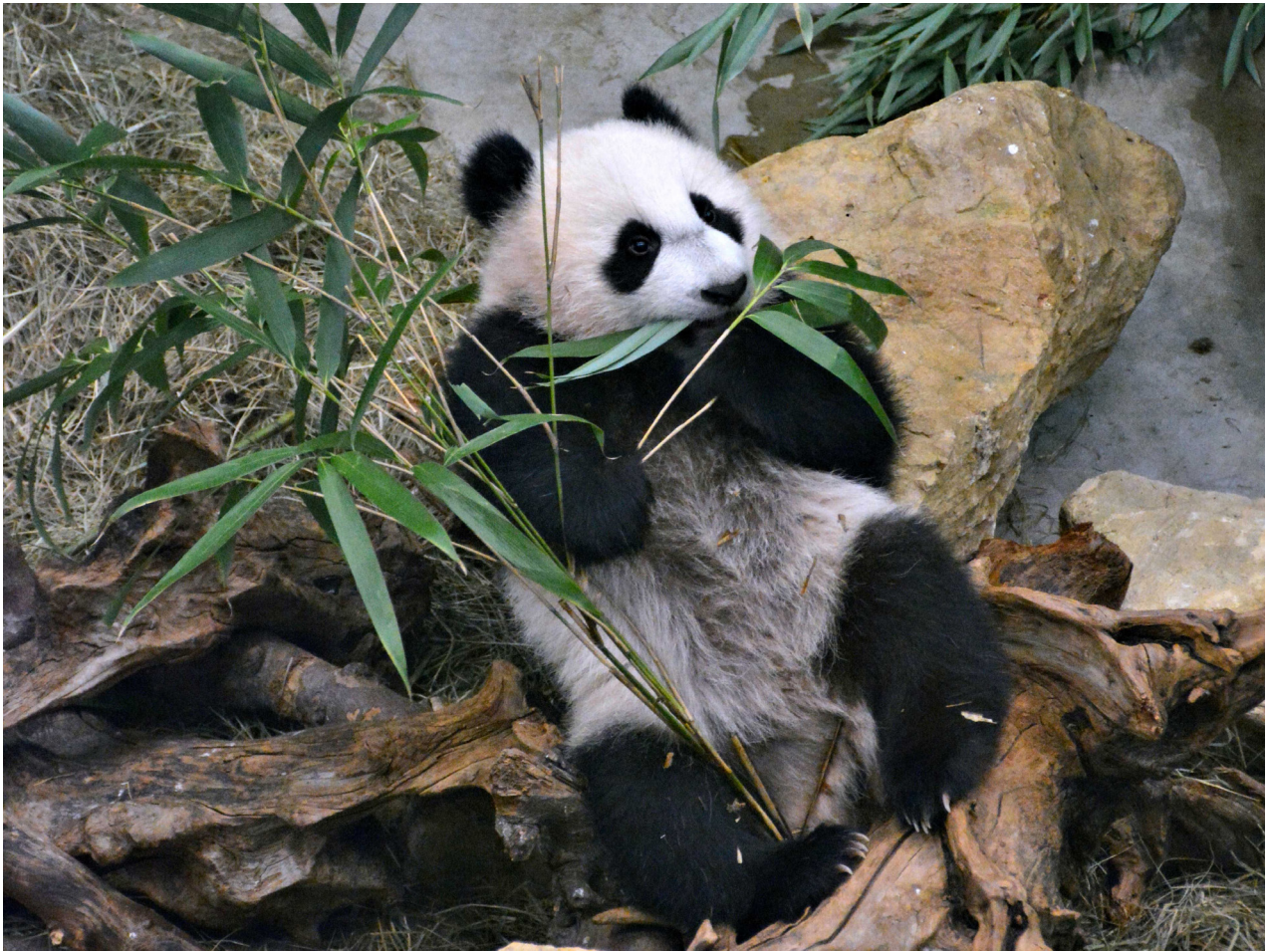
Un panda grignotant des feuilles de bambou.