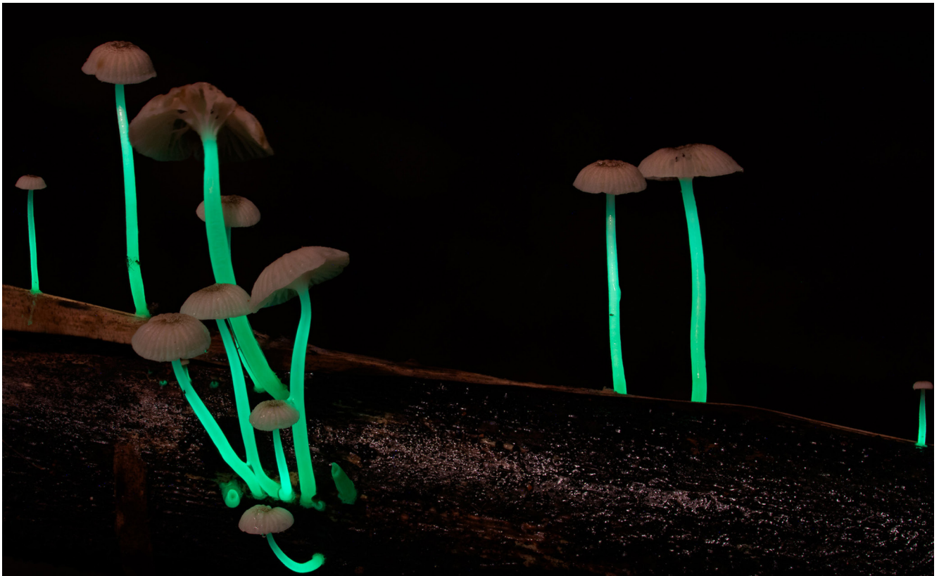
Des Roridomyces phyllostachydis éclairent du bambou d'une lueur enchantée, près d'un ruisseau à Meghalaya, dans le nord-est de l'Inde.