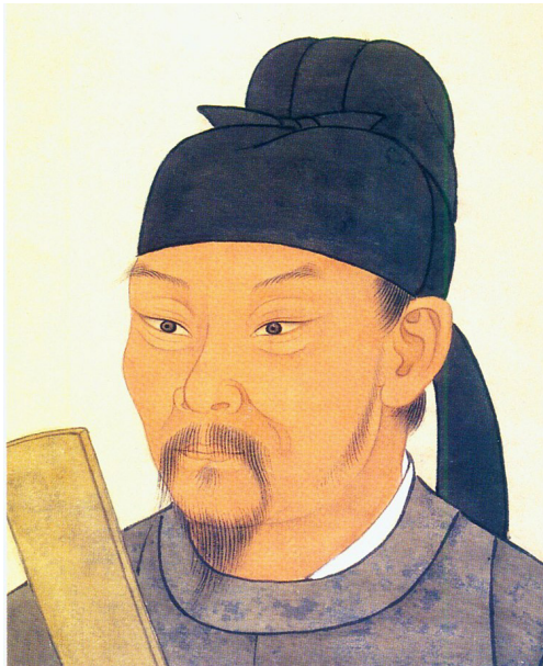
Vue d'artiste de Du Fu.

Écrit par Du Fu (712-770) sous la dynastie Tang, Gérer la maison est une grave réflexion sur le passage du temps. Du Fu est l'un des poètes chinois les plus renommés et ses œuvres sont étudiées quotidiennement dans les écoles. Élevé dans une famille d'érudits, il passe une grande partie de sa jeunesse sur la route, où il étudie le confucianisme et est apprécié pour sa poésie. Il est bien considéré par la cour impériale, bien qu'on ne lui ait jamais offert de titre officiel. Plus tard, lors de la rébellion d'An Lushan, il perd tout et entre dans une période de grave dénuement. Il retrouve des terres et un statut plus tard dans sa vie, et la légende raconte qu'il meurt lors d'un voyage en bateau, à la suite de 10 jours sans interruption de banquet et de beuverie.