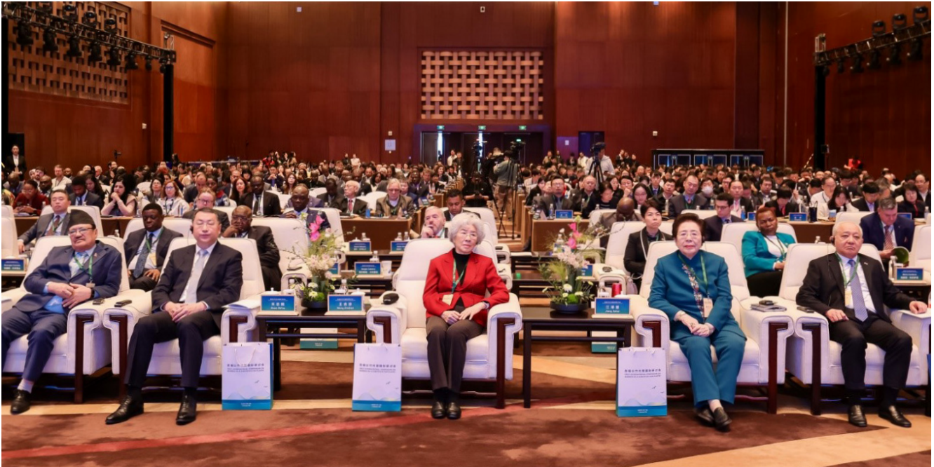
La sala de conferencias durante la ceremonia de apertura del Simposio BASP.

de utilizar tecnologías de seguimiento y plataformas digitales para los bosques de bambú, que también tienen la gran capacidad de capturar carbono. Hubo también una intensa sesión de preguntas y respuestas entre los asistentes y los ponentes sobre la gestión de los recursos y los sistemas de suministro, en la que se abordaron las teorías más avanzadas en este campo y las posibles áreas de desarrollo futuro.