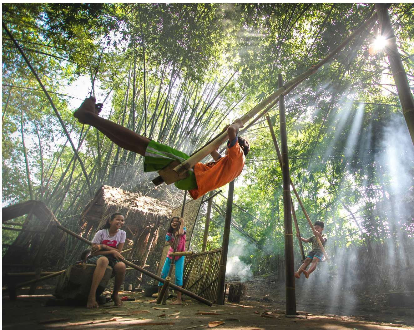
Primer puesto en la categoría Alternativas para el plástico, “Jugando en el bosque de bambú”, de Wahyu Budiyanto de Indonesia.

Cada año que pasa, la tarea de seleccionar a los ganadores se vuelve más difícil, ya que sigue aumentando el número de fotografías excepcionales que muestran la magnificencia del bambú y el ratán. Este año, el número de participantes ha superado todas las expectativas, con más de 300 obras procedentes de numerosos países de todo el mundo.