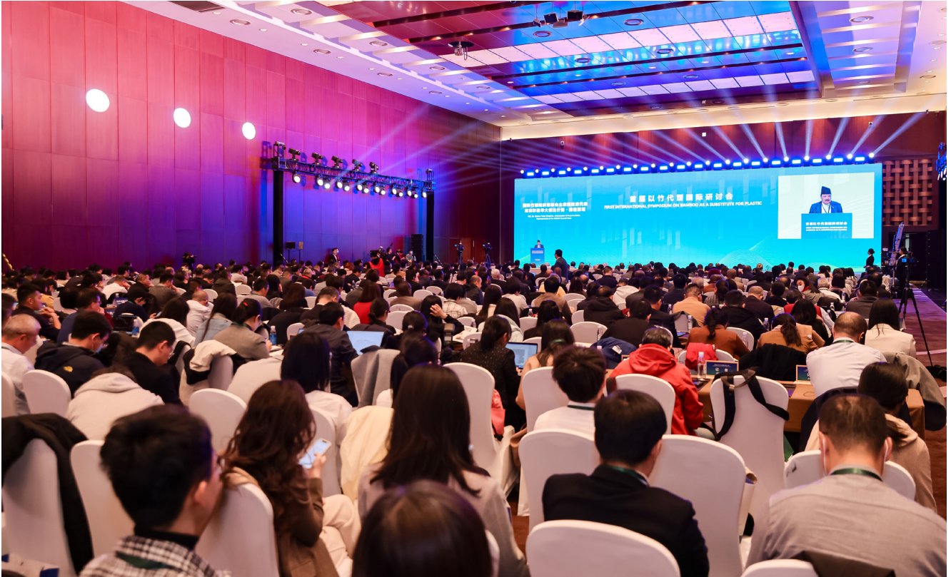
Delegados de alto nivel intervinieron durante la ceremonia de apertura del Simposio.

En el acto intervinieron destacados oradores que hablaron sobre la promesa del bambú para hacer frente a la contaminación por plásticos.