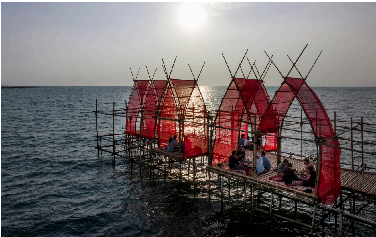
Pabellón de degustación de ostras en Tailandia.