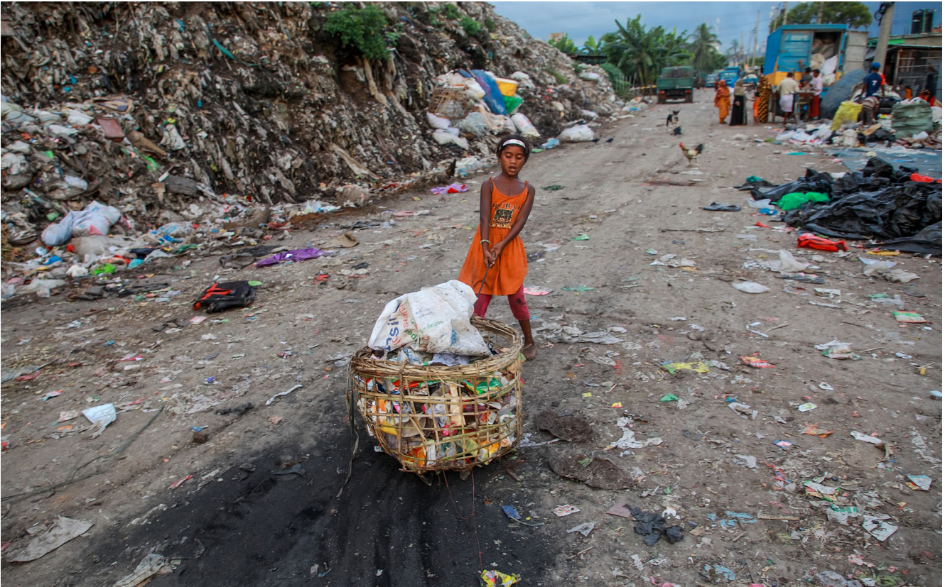
Llevando residuos vendibles con una cesta de bambú.

desarrollando recursos sostenibles viables que podrían ayudar a marcar el camino a seguir.