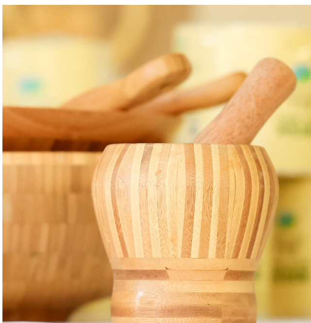
Con el bambú se pueden obtener más de 10,000 productos diversos.

La mayoría de los fabricantes de bambú son pequeñas y medianas empresas (PYME), que carecen de acceso a capital de inversión para aumentar la escala de producción. Esto mantiene los costos de producción altos, lo que también se refleja en un precio de etiqueta más alto, y las tecnologías de procesamiento más avanzadas llegan a estar fuera del alcance de estos fabricantes. Estos obstáculos dificultan gravemente la capacidad del bambú para ser competitivo con los plásticos desde una perspectiva de mercado. La cosecha y el preprocesamiento también representan una parte considerable de los costos totales, lo que limita la capacidad de estas empresas para obtener beneficios e invertir en nuevas tecnologías