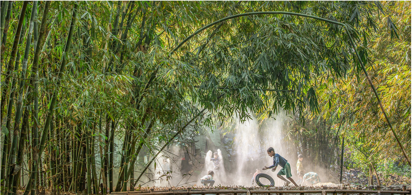
El bambú crece en todo el mundo, especialmente en el Sur Global.

El apoyo práctico incluye ofrecer orientación a los responsables políticos, ayudar a desarrollar normas para facilitar el comercio y garantizar productos de alta calidad, proporcionar capacitación y experiencia a los socios, fomentar la colaboración de múltiples partes interesadas, ya sea Sur-Sur, Triangular u otras formas de cooperación, crear sinergias con otros marcos internacionales como el CIN, lanzar campañas de concienciación pública, apoyar la investigación de nuevos productos y técnicas, crear vínculos en toda la cadena de valor y actuar como intermediario mundial del conocimiento. La Iniciativa del Bambú como Sustituto del Plástico es una reciente iniciativa pionera que pretende aprovechar los recursos mundiales de INBAR para utilizar el bambú en la lucha contra la crisis de la contaminación por plástico. Otro de estos recursos es La solución del bambú a la contaminación por plásticos, un nuevo reporte publicado recientemente en el marco del proyecto del Centro de Comercio, Desarrollo y Medio Ambiente que consolida y expone la situación actual del bambú para reducir los residuos plásticos y hacer frente al cambio climático.