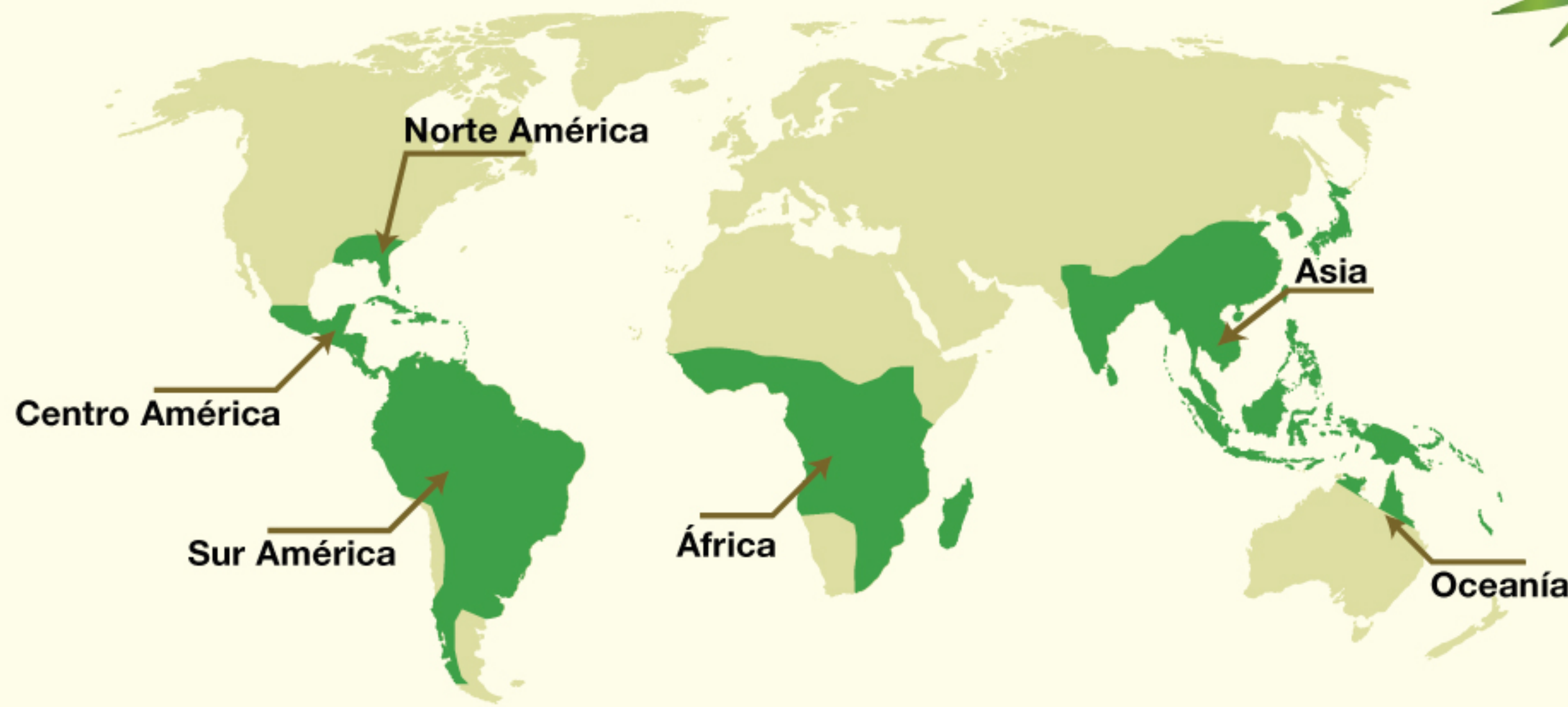
Distribución natural del bambú en el mundo