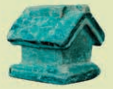
Maqueta Chorrera 1800 A.C.