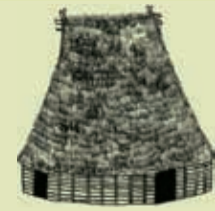
Casa Cultura Valdivia 4300 a 1500 A.C.

El bambú forma parte del patrimonio cultural, ha estado presente en culturas como la Valdivia, Chorrera, Jama -Coaque, Tolita-Tumaco.