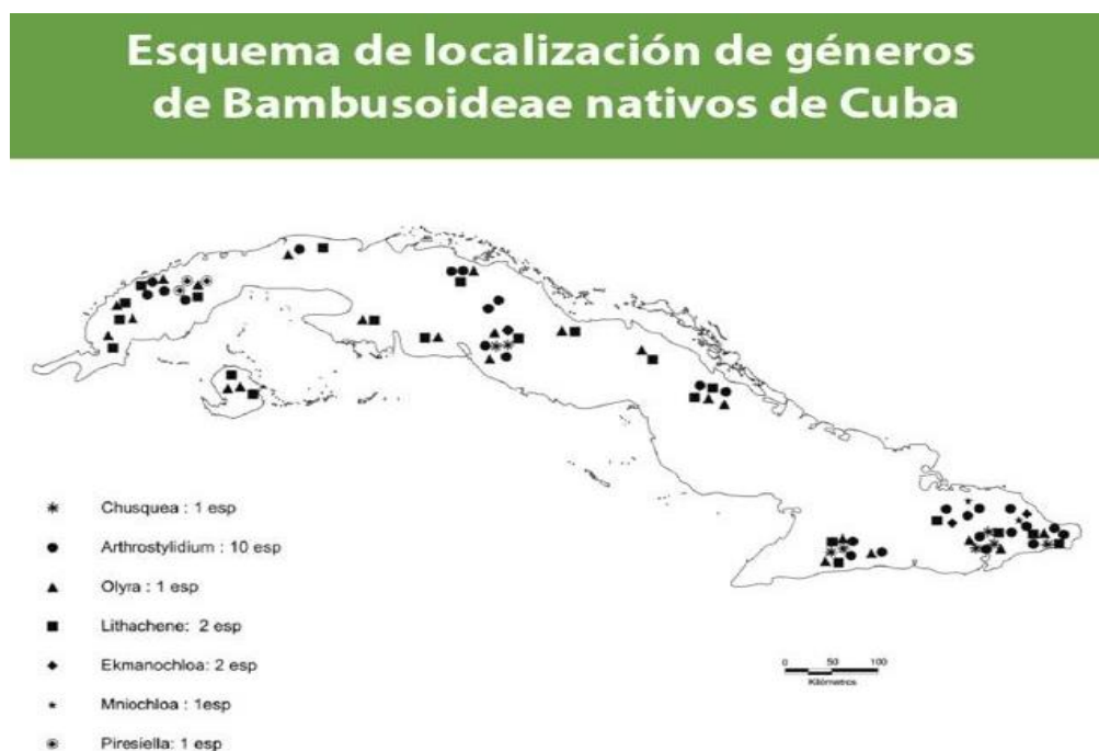
Figura 1. Esquema de localización de género de Bambusoideas nativos en Cuba

Los bambúes nativos (Figura 1) tienen un lugar significativo en la diversidad biológica cubana, por su alto endemismo, rareza, la mayoría con presencia y distribución puntual, con poblaciones de pocos individuos que mayormente viven en hábitats de ecosistemas específicos y con diferentes grados de amenaza. La mayor diversidad genérica y específica de bambúes nativos en Cuba se distribuye en orden de importancia como sigue: a) en el centro norte del este de la Isla (Nipe-Moa-Baracoa, provincias de Holguín y Guantánamo), b) al oeste del país (La Cordillera de los Órganos hasta la Sierra del Rosario) y c) en las montañas del centro sur del país (Guamuhaya, provincias de Cienfuegos, Villa Clara, Sancti-Spíritus).