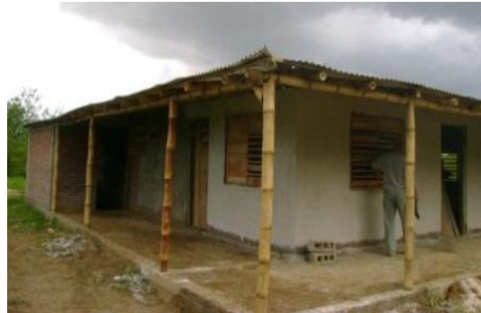
Figura 3. Vivienda construida en Bayamo

y el Desarrollo Económico con siglas COSUDE (Figueredo, 2010). La especie utilizada fue la Bambusa vulgaris , si bien es cierto no es tan eficiente como otros géneros y especies de culmos más rectos y de mayor diámetro, los resultados obtenidos demostraron la posibilidad de usar la misma con este propósito.