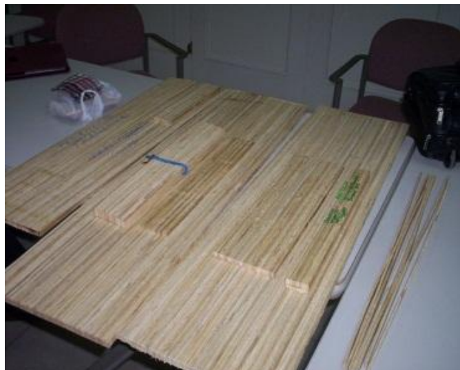
Figura 6. Tableros multipropósitos