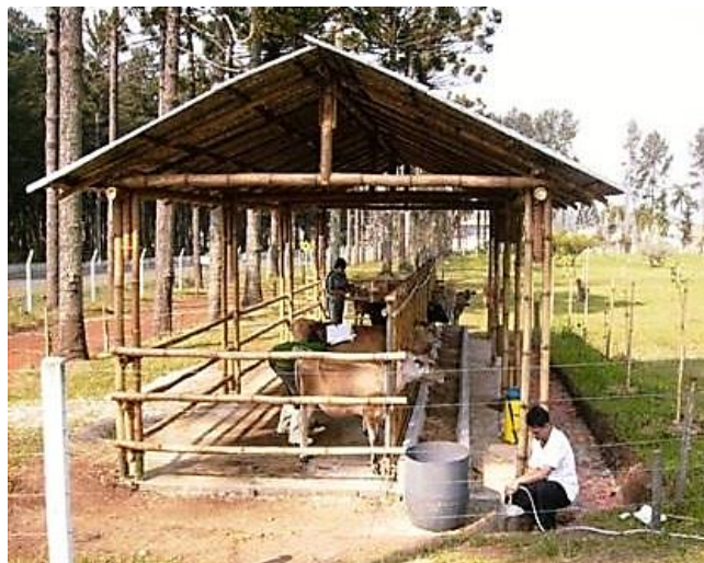
Figura 5. Instalaciones Pecuarias