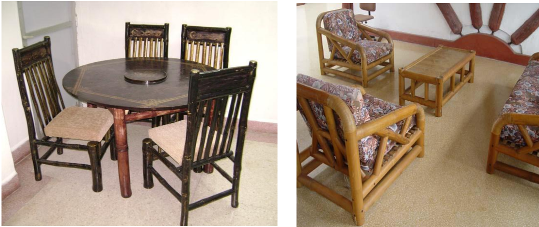
Figura 4. Muebles fabricados en Holguín