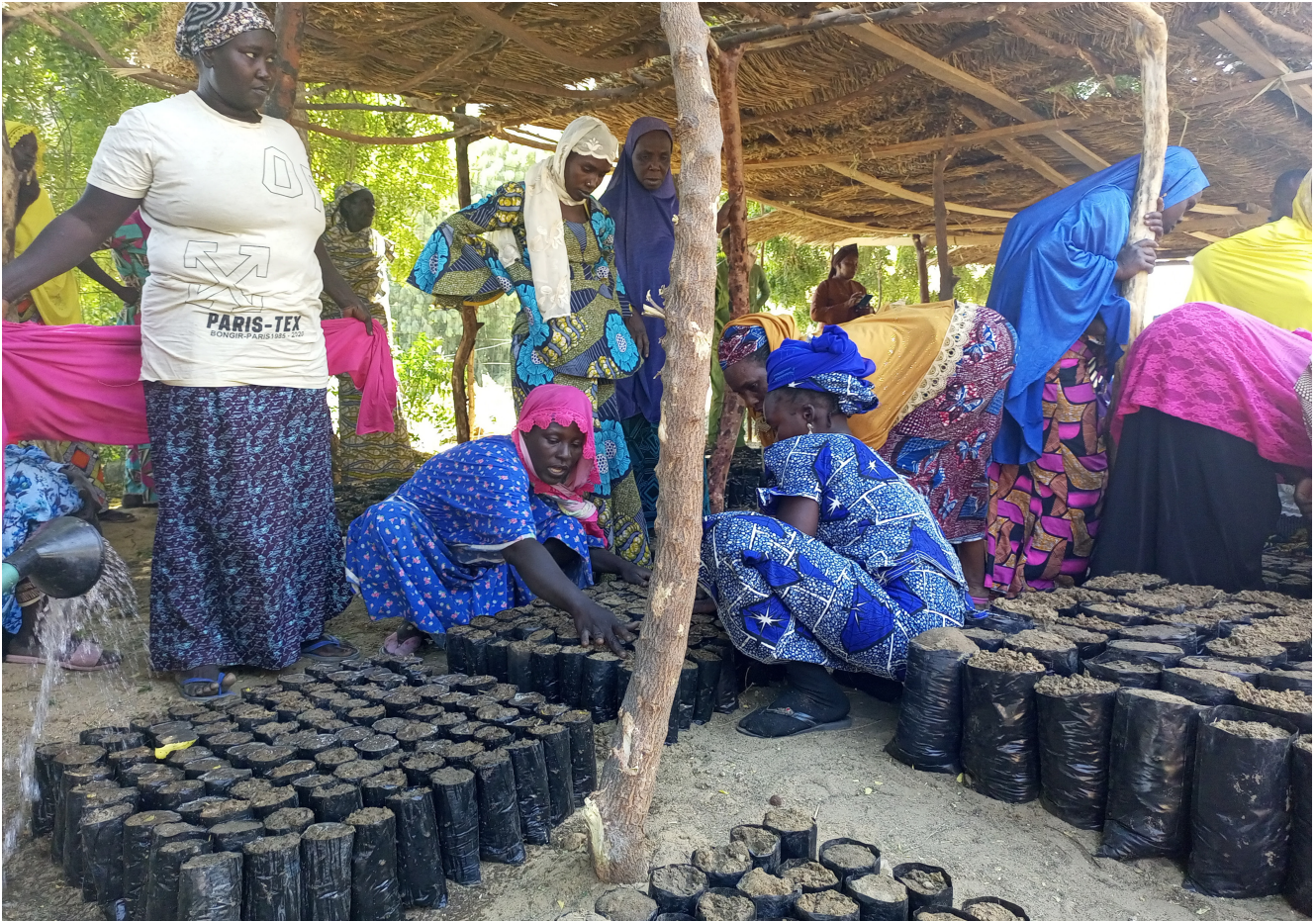
Le charbon de bambou représente une solution de substitution au charbon de bois, à la fois plus respectueuse de l'environnement et économiquement viable.

du soutien, de l'incubation et du développement local, il propose des méthodes, des outils et des conseils concrets adaptés aux réalités du terrain. Il a été conçu pour stimuler l'autonomie, la rigueur et l'innovation des porteurs de projets, tout en leur donnant les moyens de transformer leurs idées en initiatives concrètes et porteuses d'impact.