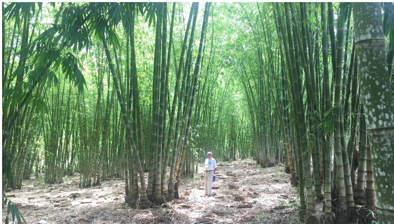
Plantation commerciale de Dendrocalamus asper âgée de 12 ans, dans l'État du Minas Gerais (région Sud-Est), développée par l'entreprise BAMBUGX.

ses enseignements au sein d'un mouvement mondial croissant en faveur des solutions climatiques fondées sur la nature.