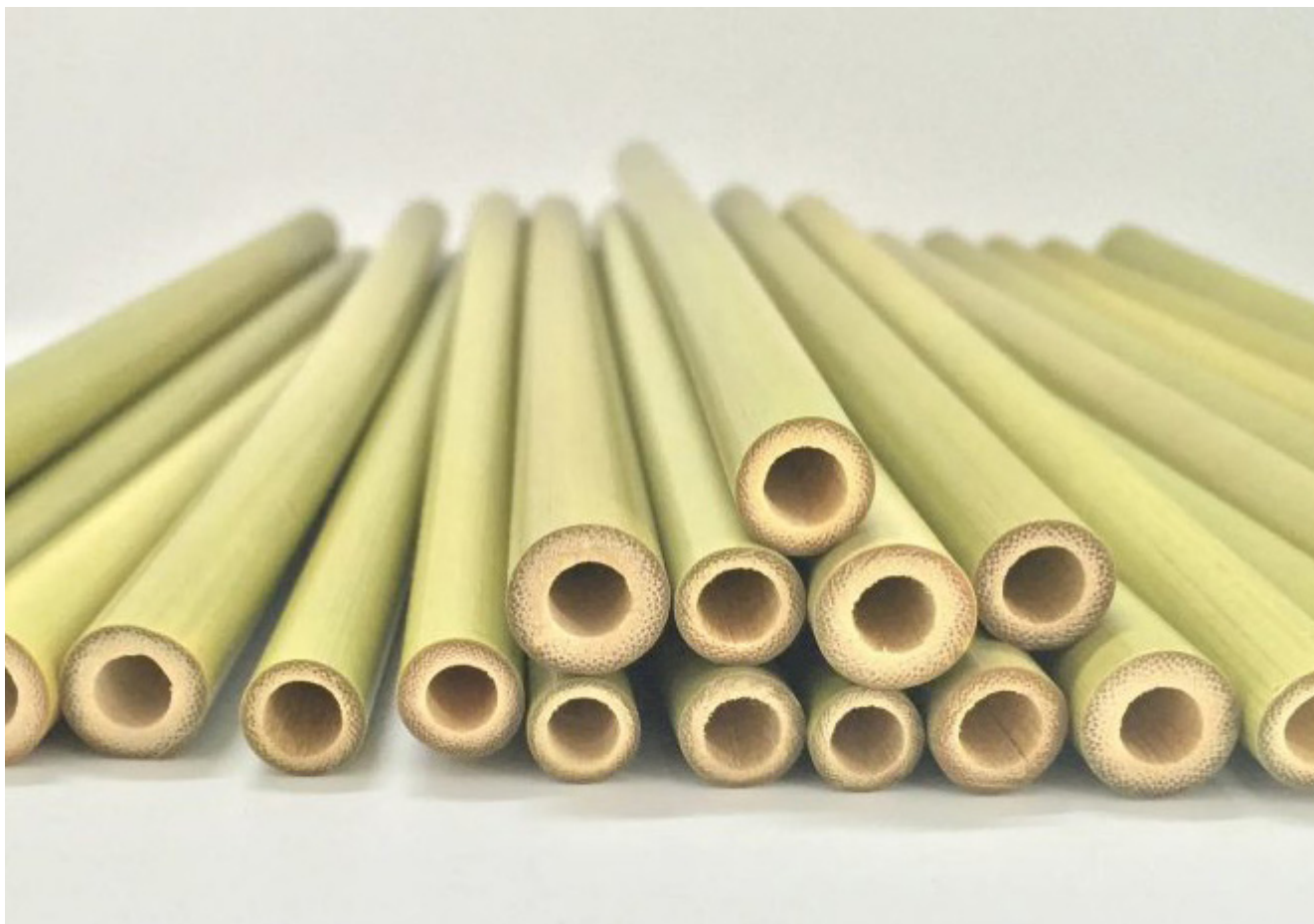
Pailles en bambou fabriquées à partir de chaumes ou de branches de petit diamètre.