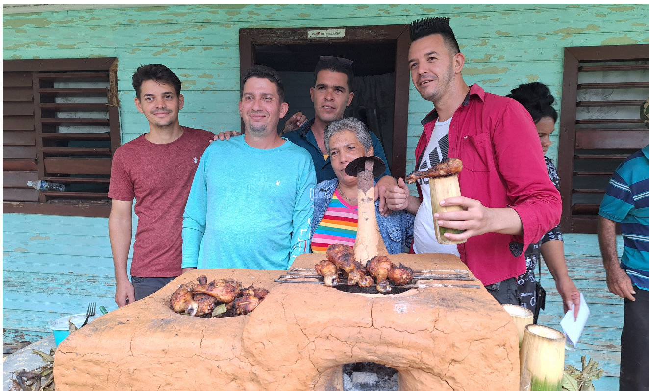
Cuisson sur un poêle de masse « rocket » avec du charbon de bambou

À plusieurs centaines de kilomètres de là, dans la paisible ville de Viñales, à Cuba, une autre transformation est en cours. C'est ici, à l'Institut de recherche agroforestière, qu'un groupe d'agriculteurs, de chercheurs et de techniciens se réunit autour d'un