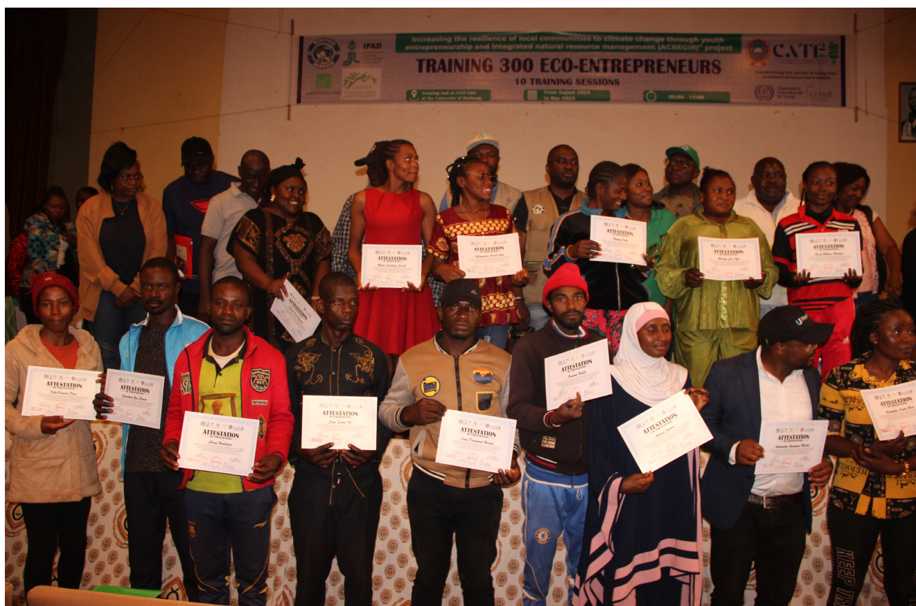
Les acteurs locaux ont été formés à la création d'éco-entreprises inclusives, destinées aux populations défavorisées.

La forte dépendance des populations vivant à proximité