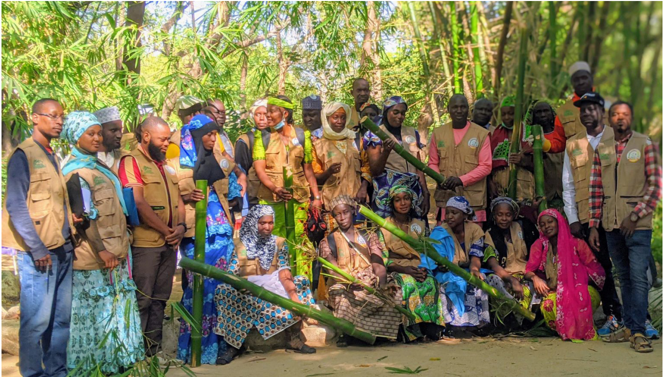
Atelier sur la création de pépinières de bambou organisé au Cameroun à la fin de l'année 2024 dans le cadre de l'initiative PADFA II-INBAR.

L'INBAR commande des recherches, met en œuvre des projets et sensibilise le grand public au bambou et au rotin à travers ses 52 États membres.