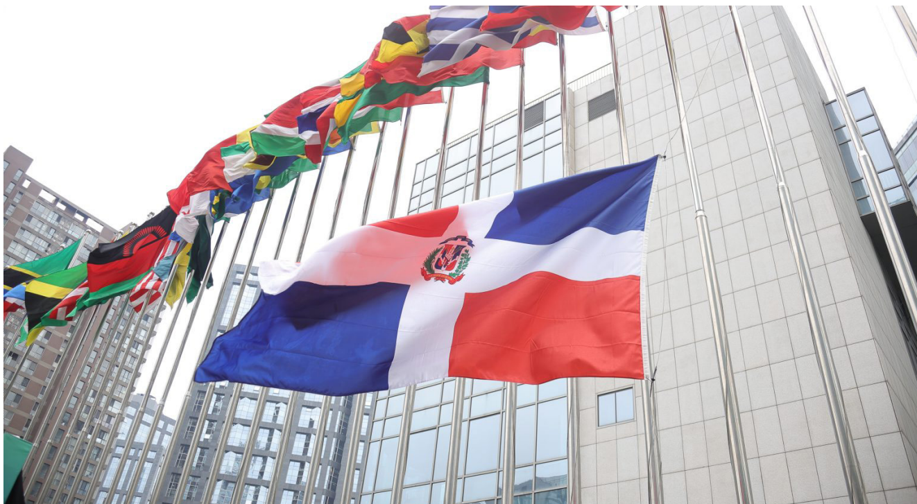
La cérémonie de levée du drapeau de la République dominicaine s'est tenue au siège de l'INBAR le 22 mai.

les écoles d'agriculture de terrain, de renforcer les formations techniques à la transformation du bambou, de diversifier les sources de revenus et d'organiser des voyages d'étude afin d'intensifier le partage de connaissances et d'amplifier les impacts au sein des communautés rurales.