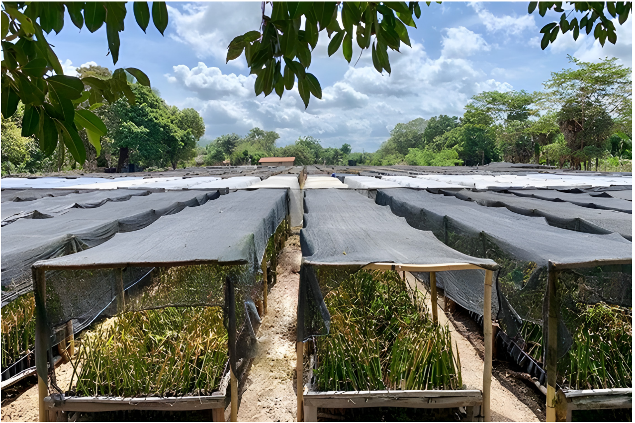
Production de plants de bambou Bambusa vulgaris dans l'État du Maranhão (région Nord-Est), Brésil.