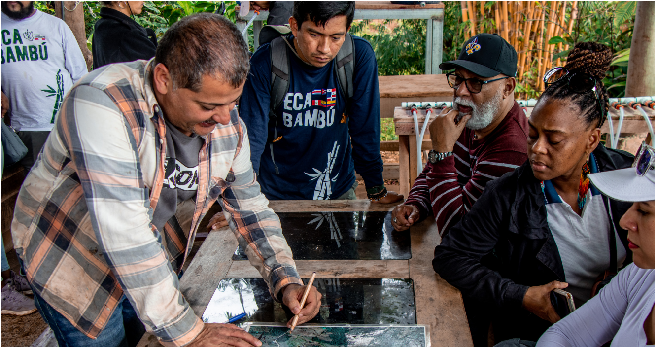
L'INBAR collabore avec les communautés locales pour cartographier et valoriser durablement leurs ressources en bambou.

curieux dispositif : un rocket stove , ou poêle de masse « dragon », modifié pour brûler du charbon de bambou.