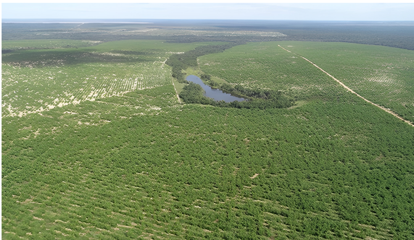
Plantation commerciale de Bambusa vulgaris dans l'État du Mato Grosso (région Centre-Ouest).