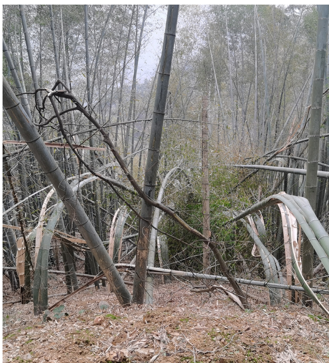
Bambous endommagés par le gel et la neige.

leur aire de répartition vers des latitudes plus élevées. Les projections issues de modèles indiquent qu'une augmentation de 2 °C des températures pourrait entraîner une expansion de 15 à 20 % de la couverture forestière en bambou à l'échelle de la Chine. Cette progression devrait être particulièrement marquée dans les régions karstiques du Sud-Ouest, où les sols riches en silice favorisent un potentiel accru de séquestration du carbone. D'un autre côté, la fréquence croissante des phénomènes météorologiques extrêmes – sécheresses, précipitations intenses – constitue une menace majeure pour la stabilité écologique des forêts de bambou. Par exemple, après les pluies diluviennes sans précédent survenues dans la province du Henan le 20 juillet 2021, les fortes précipitations ont provoqué des cas de pourriture racinaire dans certaines forêts de bambou. Cet épisode illustre la vulnérabilité de ces écosystèmes face aux événements climatiques extrêmes.