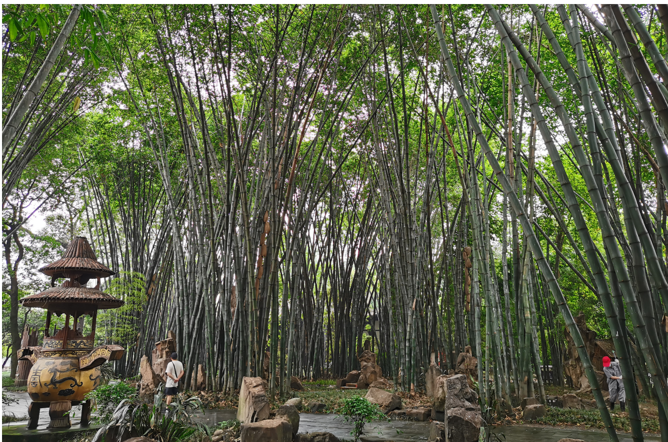
Forêt de bambou dans le parc Wangjianglou à Chengdu au Sichuan.

Le bambou redéfinit les solutions climatiques grâce à sa résilience ancestrale et à sa puissance écologique moderne.