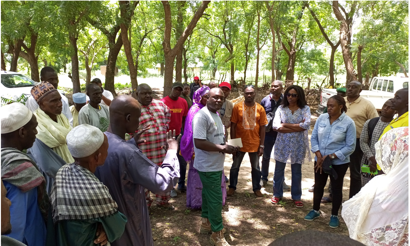
Des formations ciblées ont été dispensées à des groupes issus de diverses zones autour des trois parcs.

des parcs à l'égard des ressources naturelles, la pression exercée par les activités illégales telles que le braconnage et la déforestation, ainsi que la croissance démographique résultant de l'arrivée de personnes déplacées, à la suite des crises dans les régions du Nord-Ouest et du Sud-Ouest, et de celles provoquées par Boko Haram, compliquent l'utilisation durable de ces ressources. Il est donc essentiel pour le projet de proposer des solutions alternatives afin d'inverser cette tendance. C'est dans cette optique qu'ont été menées des campagnes de sensibilisation à l'utilisation durable des ressources naturelles, parallèlement à la mise en place d'activités génératrices de revenus. Dans ce cadre, le projet prévoit d'ici 2025 le financement de la récolte durable et de la transformation locale de produits forestiers non ligneux à potentiel commercial, ainsi que la création d'entreprises locales fondées sur la nature, afin de renforcer la résilience économique des populations face aux effets du changement climatique. À cet effet, trente éco-entreprises seront financées ou créées.